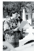
Un momento del acto.