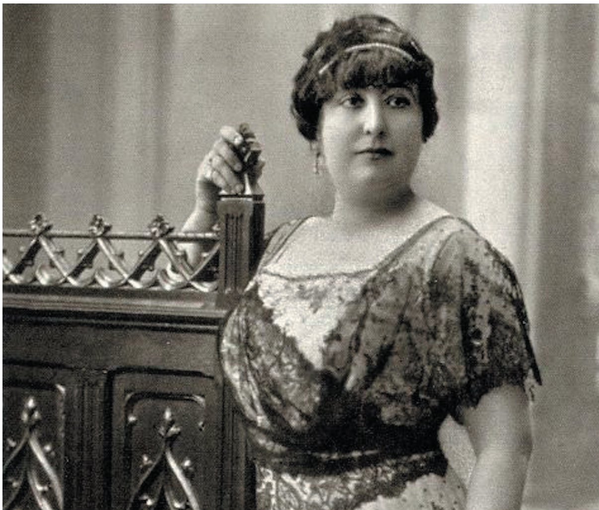
Fotografía de estudio de Carmen de Burgos hacia 1913.

Periodista, escritora y cofundadora de la revista Yorocobu