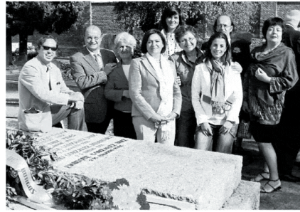
Parte del nutrido grupo de almerienses que se desplazaron para el acto en Madrid.