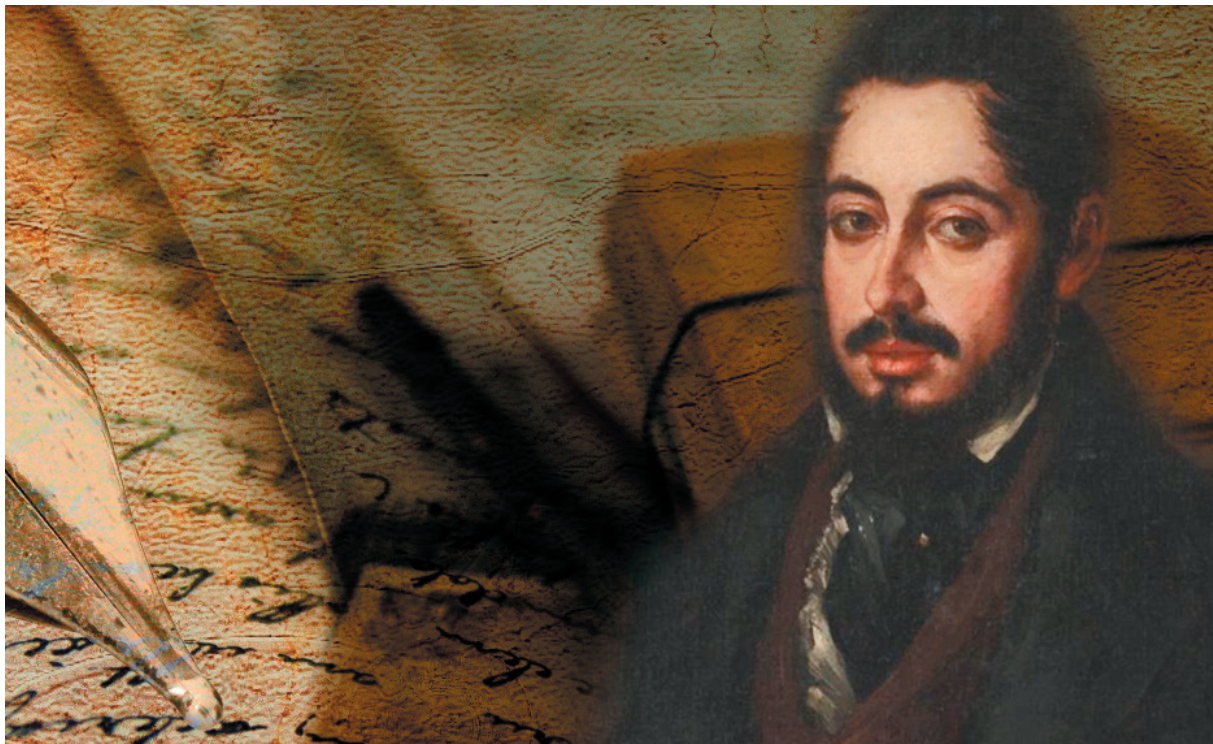
Mariano José de Larra y Sánchez de Castro, escritor romántico más conocido como Fígaro.

“Personajes del mundo cultural y político almeriense y madrileño homenajean a Carmen de Burgos reunidos, por primera vez, junto a su sepultura recién restaurada”. Noticia aparecida en el Diario de Almería el 10 de octubre de 2009.