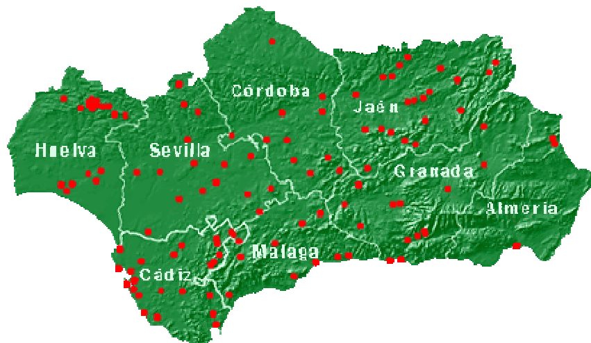
Figura 2. Mapa de los conjuntos históricos de Andalucía.

La provincia de Almería cuenta con 3 conjuntos históricos declarados, que son: Centro Histórico de Almería, Centro Histórico de Vélez-Blanco y Centro Histórico de Vélez-Rubio. Como se puede observar en la figura 2, se trata, con diferencia de la provincia andaluza que posee un menor número de espacios declarados bajo esta figura de protección.