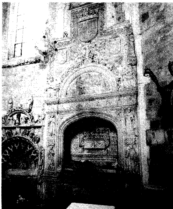
Foto 2. Sepulcro de Juan de Ortega. Vista general