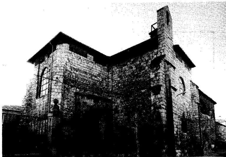
Foto 1. Real Monasterio de Santa Dorotea. Burgos