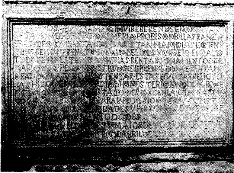
Foto 3. Detalle de la cartela principal del supulcro