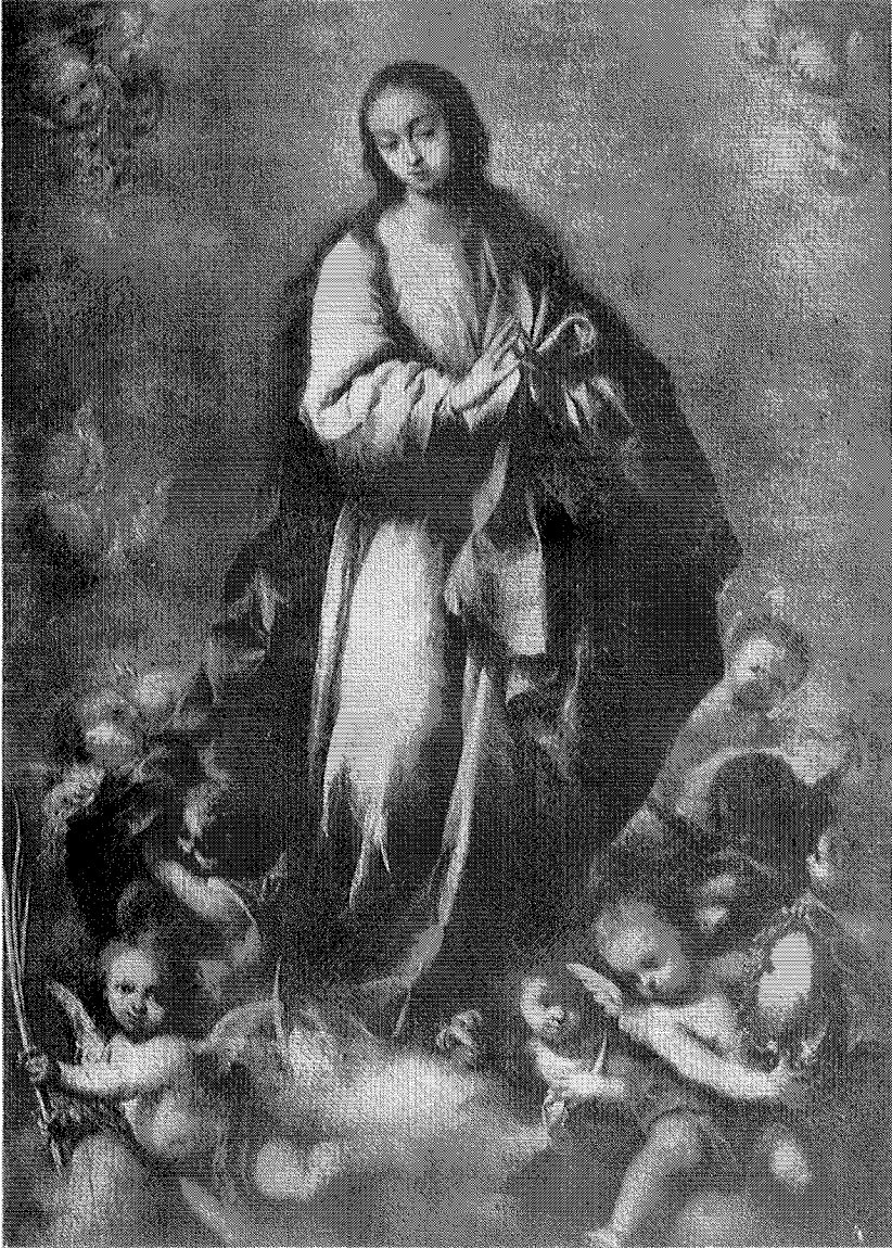
Después del retoque.