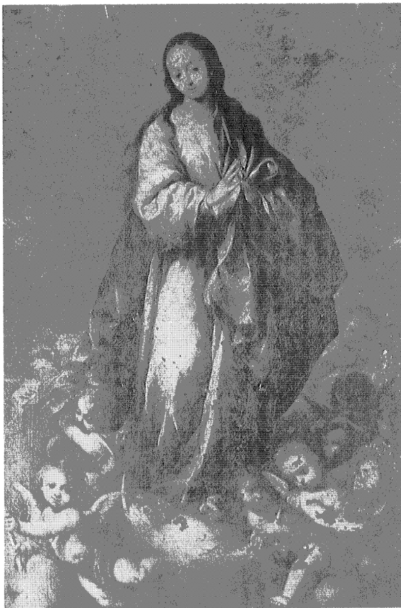
Antes del retoque.