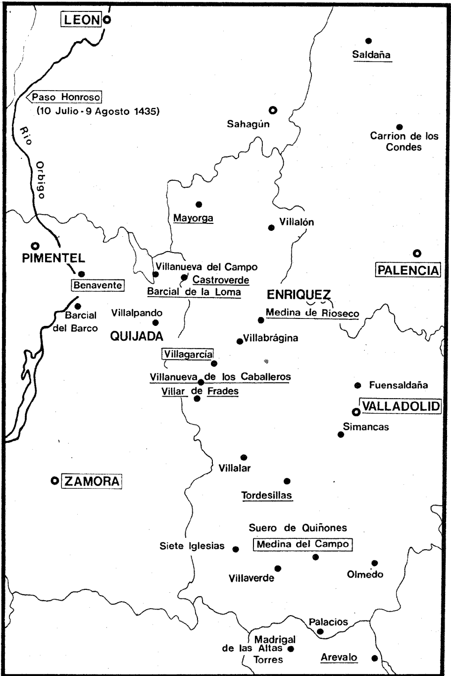
El Paso Honroso y el solar de los Quijada.