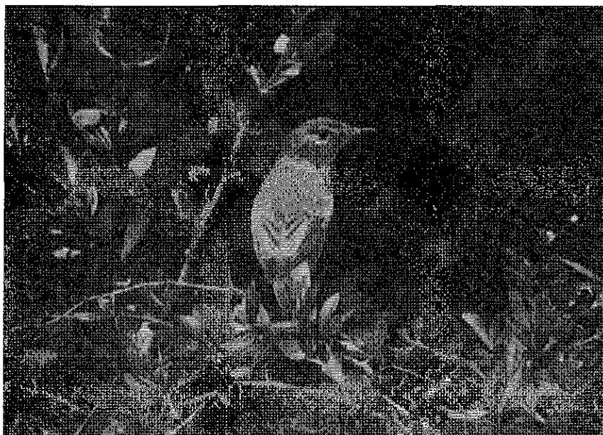
El zarcero común en la Sierra de Cazorla, Junio 1.960.