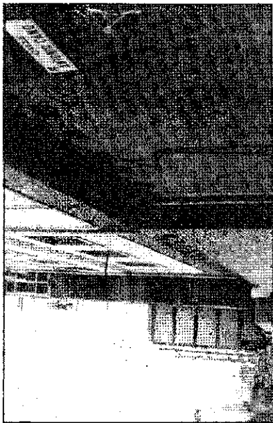
Ayer quedó inaugurada la calle que lleva el nombre de Antonio Cano