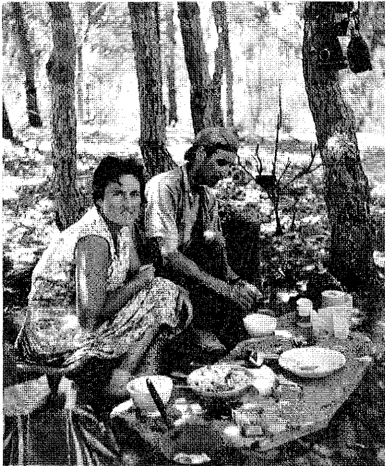
Marismas del Guadaluquivir. 28-VII-1958.