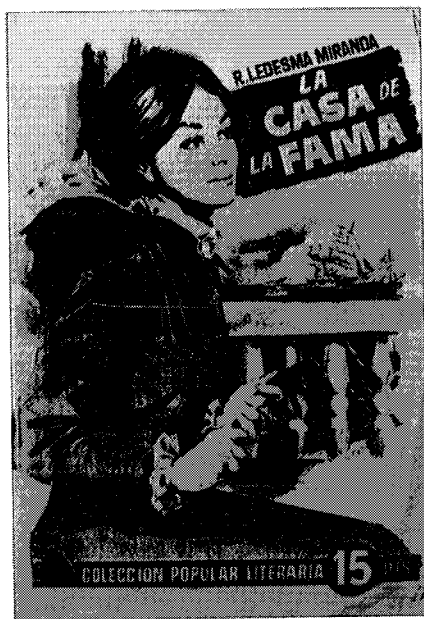
Portada de una edición de "La casa de la Fama"

Los domingos, después de la misa, oída en la capilla de la casa, don Indalecio y su familia marchaban a la Piedad, una de sus fincas de campo. Acompañábales el capellán, que había dicho misa aún más temprano en el convento. Para esas excursiones colectivas, para los viajes o para los baños, mandaba don Indalecio aparejar la góndola con sus dos troncos de mulas. La góndola fue el coche patricio de la pequeña ciudad: era una suntuosa galera de asientos laterales de fina pana, brillante enlucido y amplia berlina; tenía puerta trasera con estribo plegable 61 .