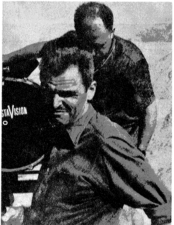
La película «Ojo por ojo» del polémico director francés André Cayatte, no tuvo el éxito que todos esperaban. Nuestro «desierto de Tabernas» continuó inédito unos años más.