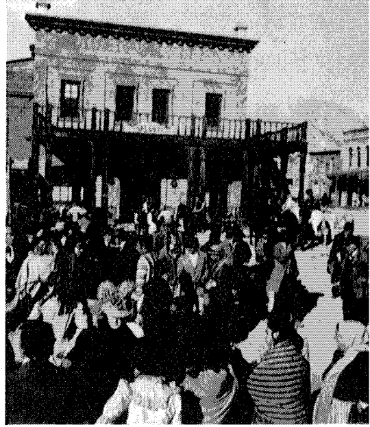
Un poblado del Oeste, hoy Mini-Hollywood.