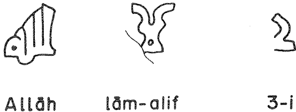
Fig. 3. Elementos morfológicos característicos de la inscripción funeraria.

mqābriyya nº 19 del 452 H, conservada en la Alcazaba de Málaga 33 , por lo que atendiendo a ese único elemento, sería de una fecha anterior a la indicada. Pero en otros signos no se advierte ese arcaísmo, sino más bien todo lo contrario, como en la traza de la figura 3, cuyo cuerpo superior adopta la forma de cuello de cisne, elemento que se inicia en la inscripción nº 18 fechada en el año 443 H. Asimismo, el nexa lām-alif encuentra su máximo paralelismo en la citada mqābriyya del 452 H, con lo cual nuestra lápida se nos sitúa hacia la mitad del s. V H, o sea, a mediados del s. XI de J.C.