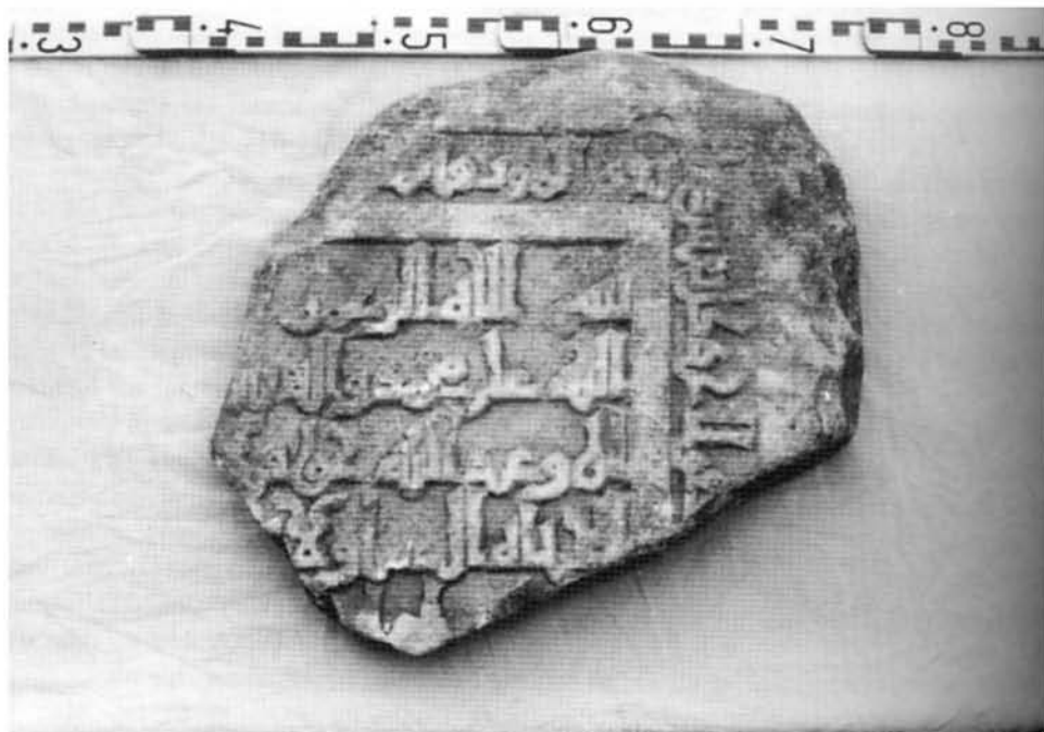
LAH. 2. Lapidaria toledana de ceros (S. XI).

salvedad, si es que se puede llamar así, del empleo en el renglón 3º de la conjunción fa- en lugar del wa- del textus receptus .