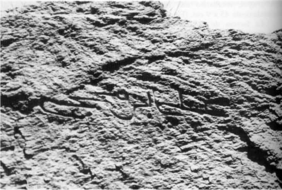
Lám. 1. Inscripción rupestre en el valle de Senés.

1) Almejuy, Almejux, Mejuy 11 , Moxahi, Moxay, Muiyiyi 12 , Almoxyuy, Almuhay 13 .