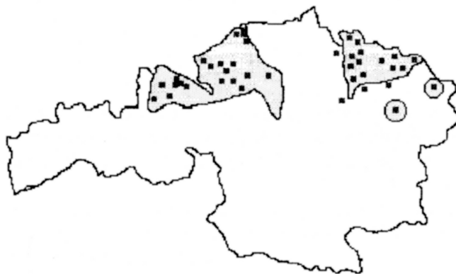
Fig. 1.- Comparación del área muestreada y las parejas de chotacabras encontradas en 1993. [Sampled area and breeding pairs of nightjar in 1993.]

En la figura 3 vemos como el hábitat típico del chotacabras en Bizkaia sale de la norma que se tenía para el resto de la Península (Asensio et al. , 1994) e incluso del País Vasco (Álvarez et al. , 1989). El ecosistema en el que más parejas se han encontrado son los brezales y prados con pinares, existiendo variaciones notables en cuanto a la cobertura de cada una de las tres comunidades. Este último año hemos podido comprobar que los chotacabras no sólo crían en claros de pinares y en sus márgenes, sino que, además, vuelan con una extraordinaria soltura entre los pinos aún en las noches más cerradas. Hemos constatado, también, que estas aves ocupan zonas de huertas y parques, incluso dentro de núcleos urbanos.