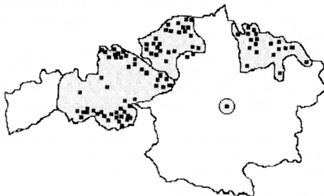
Fig. 2.- Comparación del área muestreada y las parejas de chotacabras encontradas en 1994. [Sampled area and breeding pairs of nightjar in 1994.]