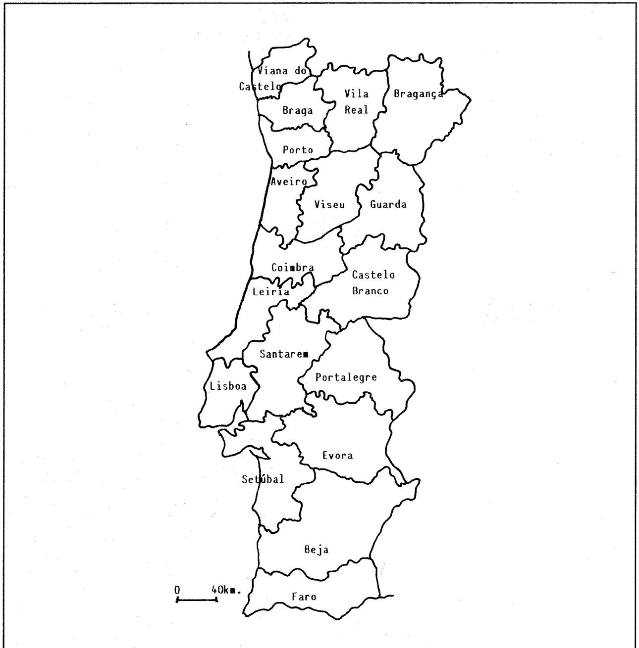
FIGURA 1. Portugal, división administrativa en distritos

la y próxima al litoral convierten la costa en alta y recorrida a diferencia de la del sector norte.