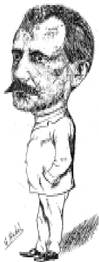
Portada de El Organillo (7 de febrero de 1899)

Tiene fama en Almería y fuera de ella, también, como escritor de valor, porque se puede en pocas y en pocas palabras decir que tiene un talento delante siempre de todos, y una pluma en el otro momento que sabe muy bien.