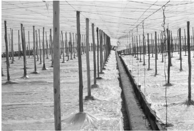
Solarización del suelo en invernadero