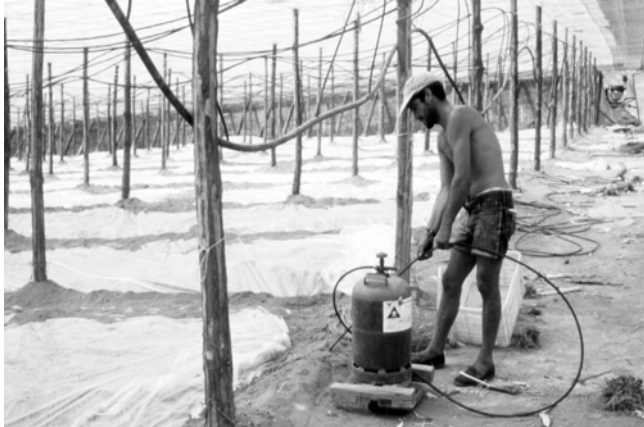
Desinfección de suelo con bromuro de metilo. Esta práctica está prohibida en la P.I.