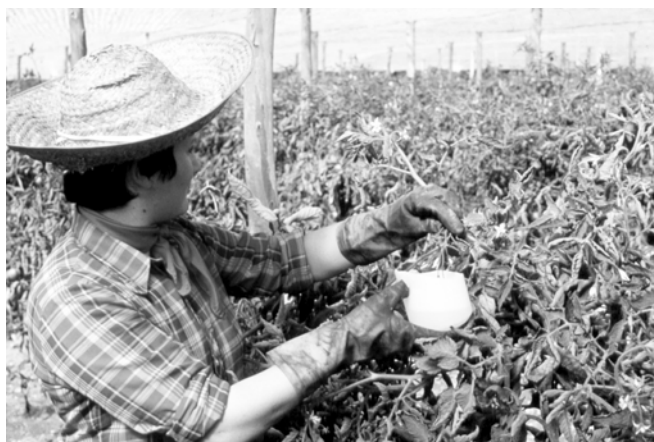
Aplicación de fitohormonas en tomates. En P.I. esta práctica está prohibida