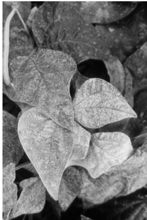
Telas de araña roja en judía