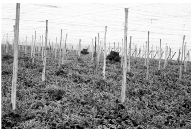
Colmenas en invernadero de sandías