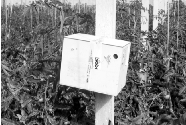
Colmena de abejorros en invernadero de tomates