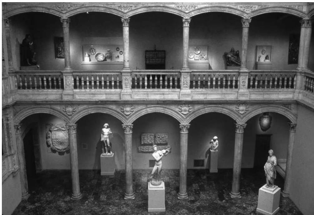
ALA SUR DEL PATIO DE HONOR, INSTALADO EN EL MUSEO METROPOLITANO.

de todo el País Vasco. La rehabilitación del castillo (continente) y el proyecto interpretativo futuro junto con los propios valores culturales y artísticos del monumento (contenido), deben servir de catalizador de la cultura y el turismo de Vélez Blanco y toda la comarca.