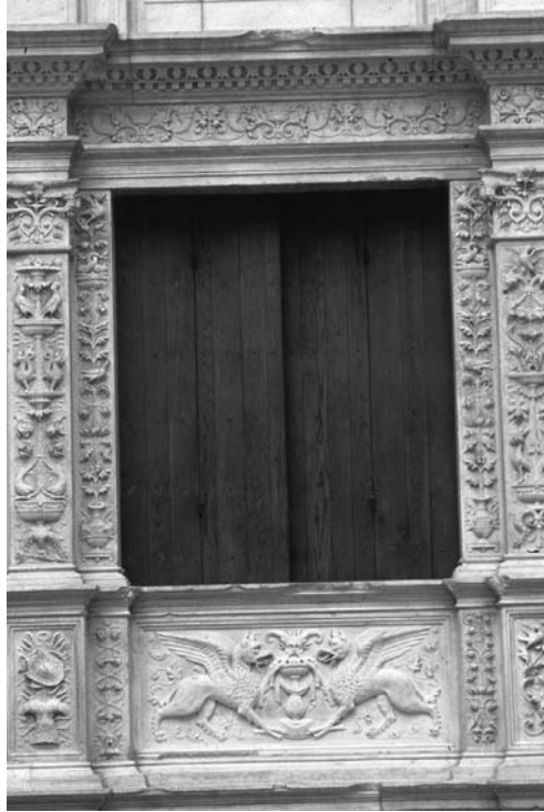
VENTANA DECORADA CON GRUTESCOS, CORRESPONDIENTE AL ALA OESTE. MUSEO METROPOLITANO DE NUEVA YORK.

marcarán las estrategias de difusión e interpretación del castillo, dentro del proyecto global del Plan Director: