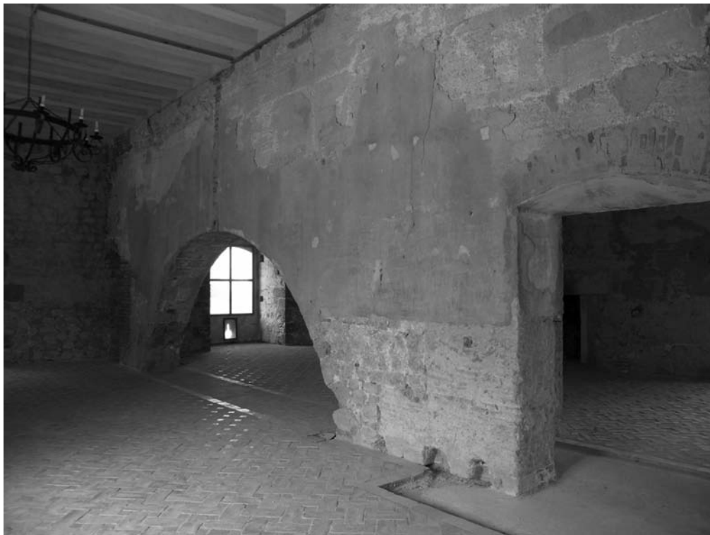
SALONES DEL TRIUNFO Y LA MITOLOGÍA, HOY VACÍOS, PERO QUE DEBERÁN INCORPORAR UN CONTENIDO INTERPRETATIVO TRAS LA REHABILITACIÓN.

tualmente alberga de manera temporal la inauguración de la exposición itinerante “El marquesado de Los Vélez. Señorío y poder en los reinos de Granada y Murcia”, contando además con dos maquetas del palacio-fortaleza, una general y otra de detalle del Patio de Honor y espacios anexos pero una reconstrucción idealizada de su equipamiento original. Cuando no haya exposiciones temporales albergará una exposición con los 9 paneles de la antigua caseta informativa habilitada en el exterior, todo ello con el objetivo de aportar al visitante una información general sobre el edificio y sus valor significativos.