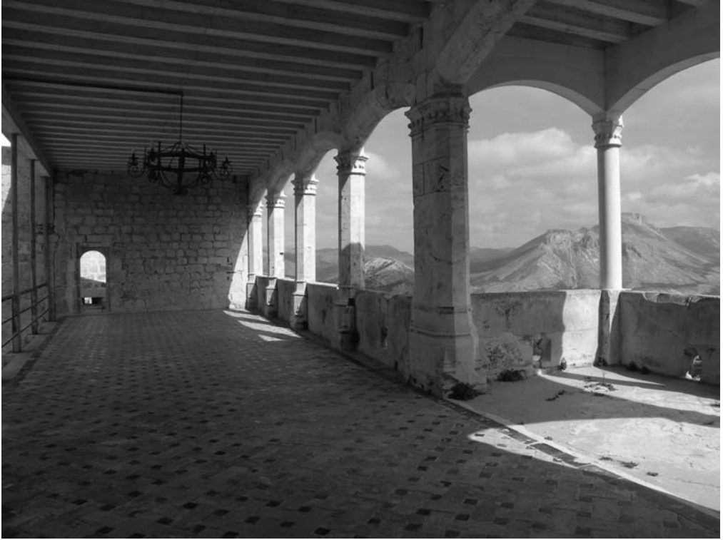
MIRADOR DEL ALA ESTE.

La reunión inicial tuvo lugar el 21 de Febrero de 2006 en la propia Delegación, y desde este primer momento se perfilaron una serie de actividades basadas en la colaboración entre todas las instituciones, pero con un esfuerzo organizativo y presupuestario de la Consejería de Cultura, que ha aportado 120.000 euros, cantidad significativa cuando no nos referimos a actuaciones constructivas y técnicas.