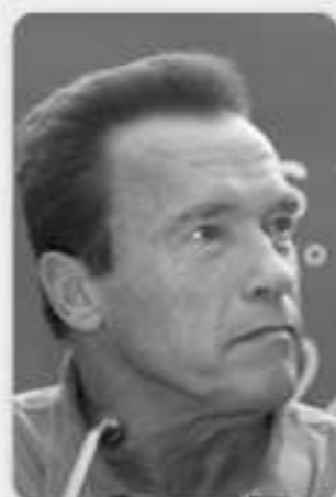
2014 | Arnold Schwarzenegger