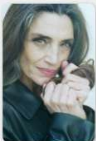
2015 | Ángela Molina