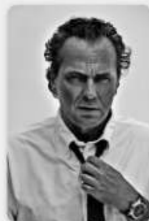
2016 | Jose Coronado