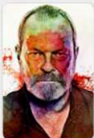
2014 | Terry Gilliam