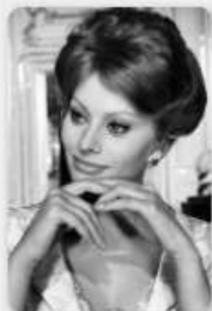
2017 | Sophia Loren