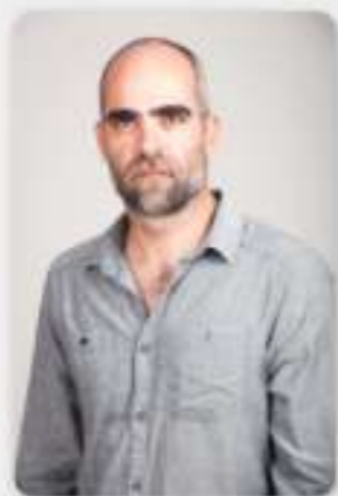
2018 | Luis Tosar