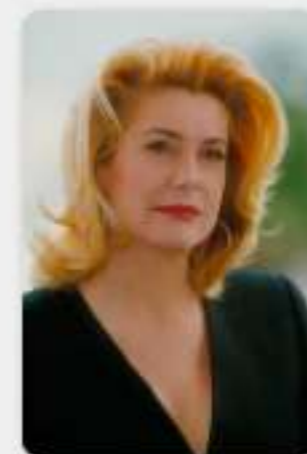
2016 | Catherine Deneuve