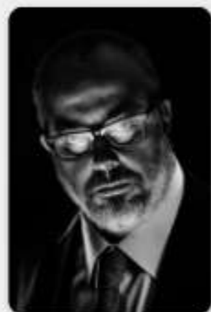
2017 | Alex de la Iglesia