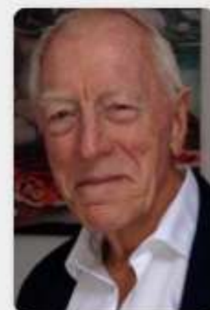
2013 | Max Von Sydow