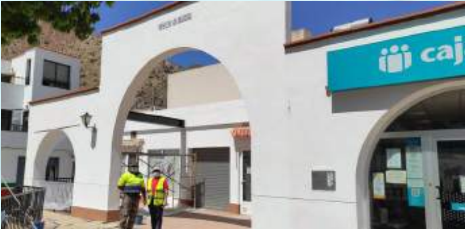
PINTURA Y BLANQUEO