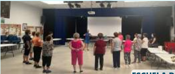
ESCUELA DE SALUD