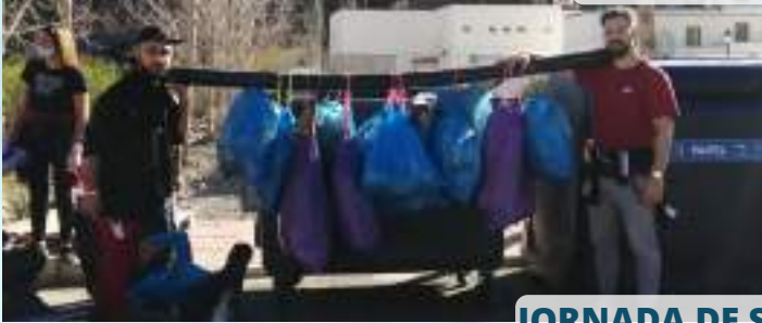
JORNADA DE SENSIBILIZACIÓN