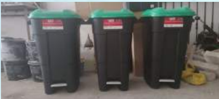
INSTALACIÓN DE CONTENEDORES