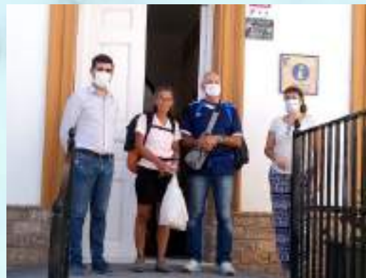
Punto de información al peregrino