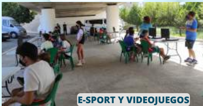
E-SPORT Y VIDEOJUEGOS