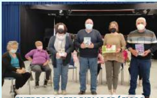
ENTREGA LOTES BIBLIOGRÁFICOS ESCUELA C.P.R. AZAHAR