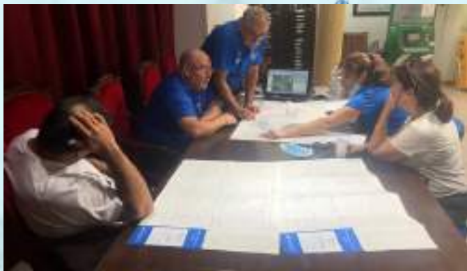
Estudio de alternativas más seguras a la carretera