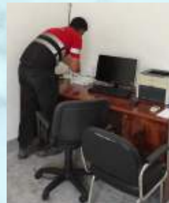
FIBRA ÓPTICA EN LAS ALCUBILLAS