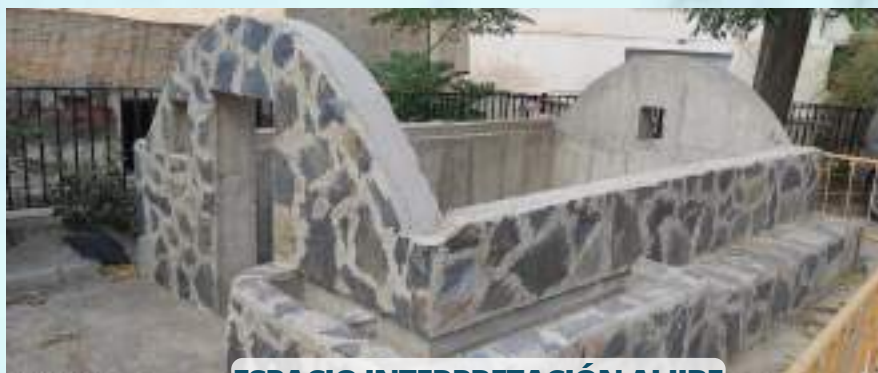
ESPACIO INTERPRETACIÓN ALJIBE