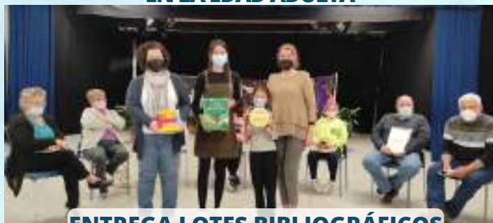
ENTREGA LOTES BIBLIOGRÁFICOS ESCUELA INFANTIL CHIMENEA DE LAS HADAS