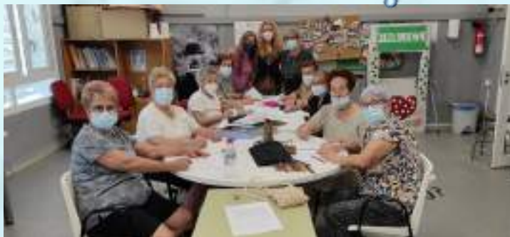
ESCUELA DE ADULTOS