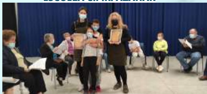
SEMANA DEL LIBRO