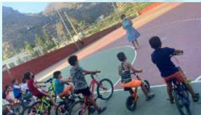
DÍA DE LA BICICLETA