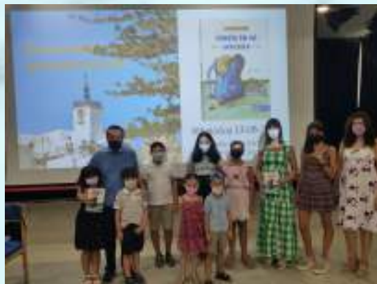
PRESENTACIÓN POESÍA EN MI MOCHILA