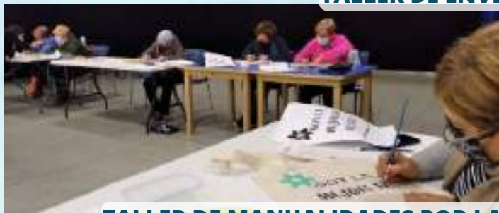
TALLER DE MANUALIDADES POR LA ASOCIACIÓN DE MUJERES AZACAYA