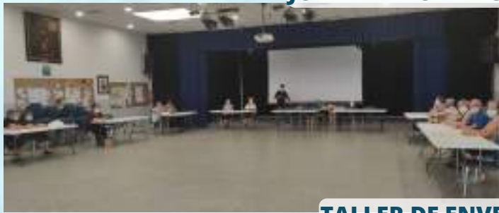
TALLER DE ENVEJECIMIENTO ACTIVO