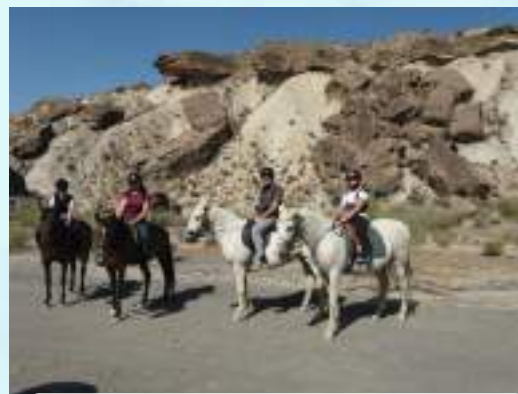
JORNADA DE MULTI-AVENTURA