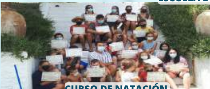
CURSO DE NATACIÓN