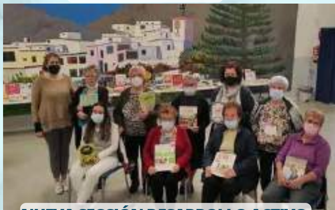
NUEVA SECCIÓN DESARROLLO ACTIVO EN LA EDAD ADULTA