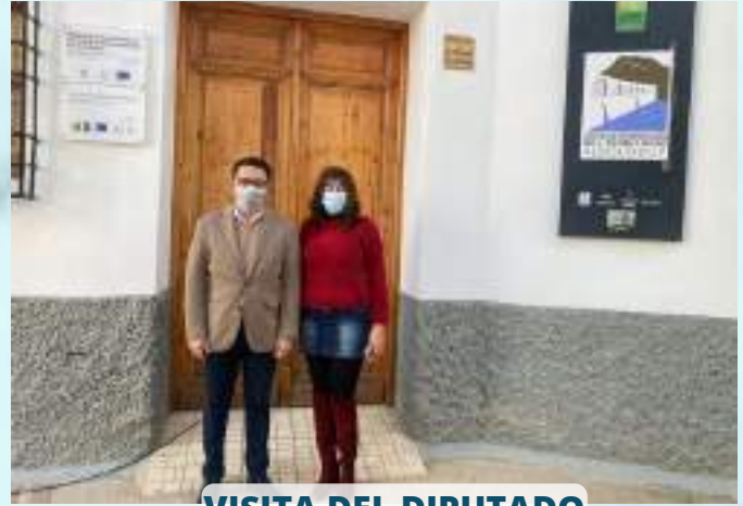
VISITA DEL DIPUTADO