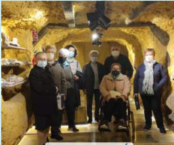
SALA DE LA GEOLOGÍA