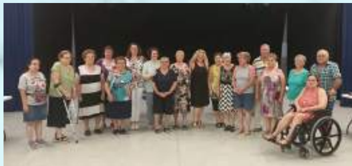
CLAUSURA ENVEJECIMIENTO ACTIVO Y ESCUELA DE ADULTOS