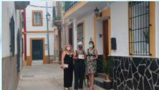
PREMIADOS CONCURSO DE FACHADAS