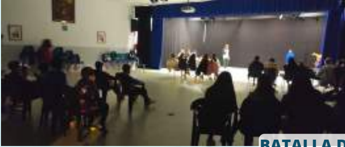
BATALLA DE GALLOS