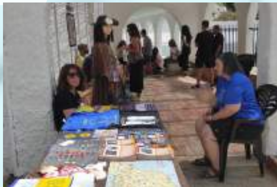
EL CAMINO MOZÁRABE