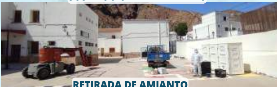
RETIRADA DE AMIANTO