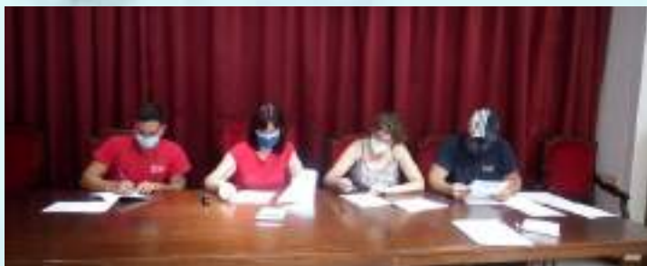
FIRMAS DE CONTRATOS DE OBRA Y ALQUILER DE EDIFICIOS MUNICIPALES