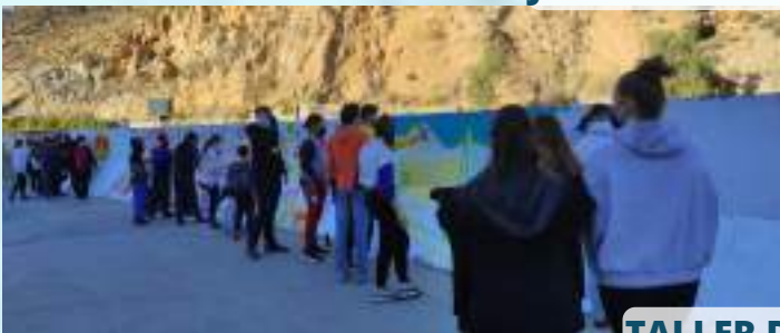
TALLER DE GRAFITI