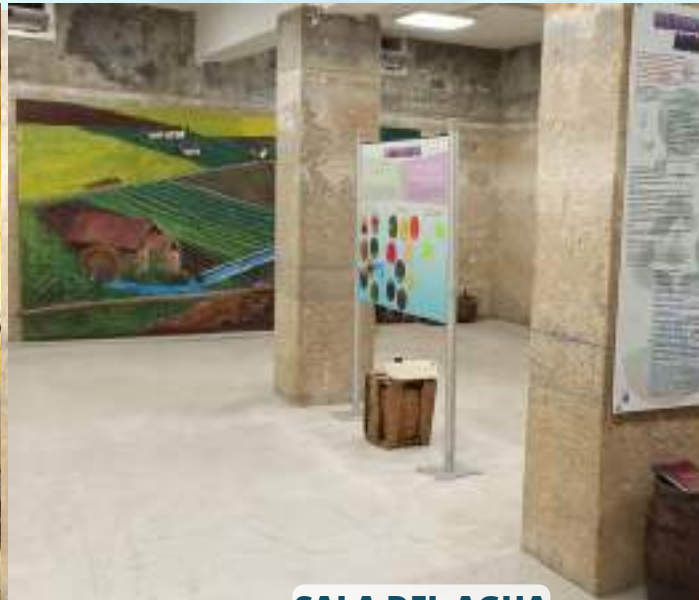
SALA DEL AGUA