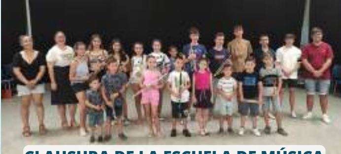
CLAUSURA DE LA ESCUELA DE MÚSICA