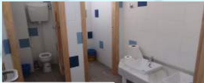
ASEOS EN C.P.R. DE LA ESCUELA DE ALBOLODUY