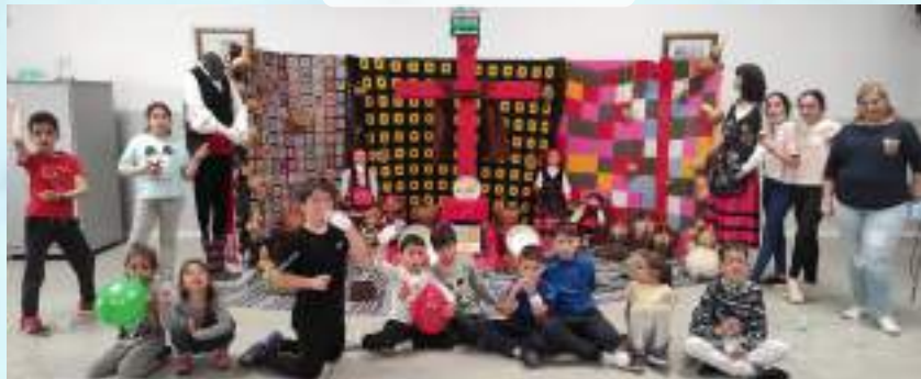
CRUCES DE MAYO