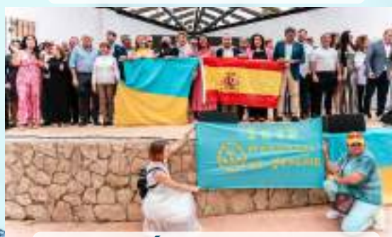
GALA BENÉFICA POR UCRANIA