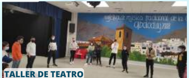
TALLER DE TEATRO