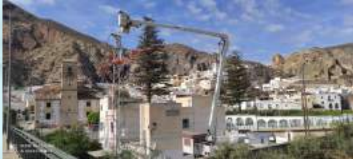
MEJORAS EN TRANSFORMADOR