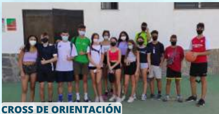
CROSS DE ORIENTACIÓN