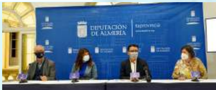
PRESENTACIÓN SEMINARIO INTERNACIONAL LA PEREGRINACIÓN DESDE EL SUR Y EL CAMINO MOZÁRABE EN ALMERÍA