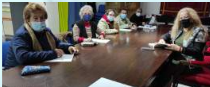
LECTURA Y COMPRESIÓN LECTORA