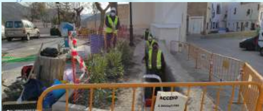
PUESTA EN VALOR DEL CAZ GENERAL