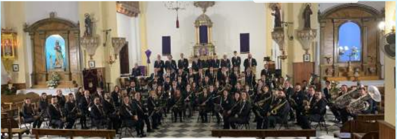
CONCIERTO SEMANA SANTA