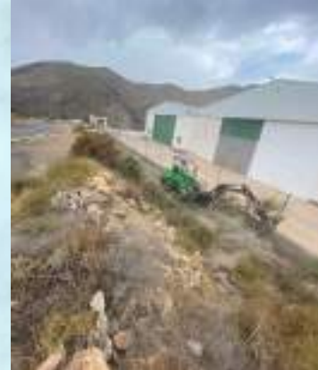
MEJORA EN NAVES MUNICIPALES