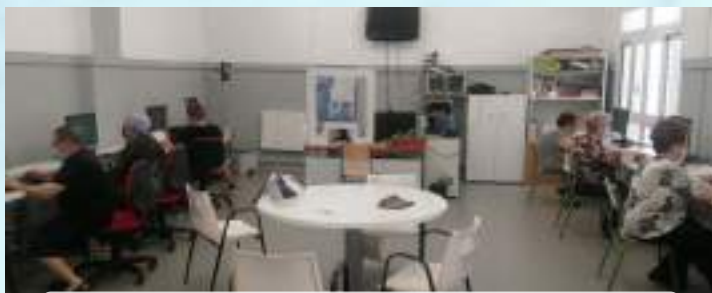
TALLER APRENDE A UTILIZAR EL CAJERO