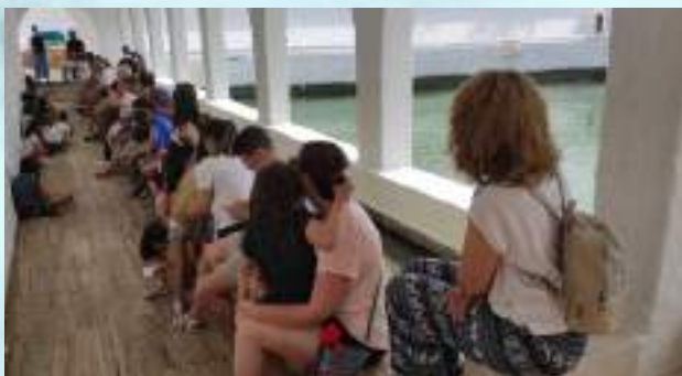
CUENTA CUENTOS MUSICALES