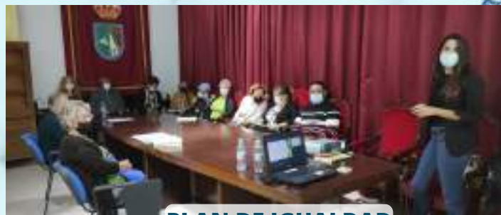
PLAN DE IGUALDAD