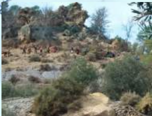
JORNADA TÉCNICA DE SENDERISMO DEL PARQUE NACIONAL SIERRA NEVADA