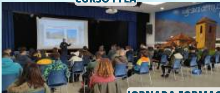
JORNADA FORMACIÓN PARQUE NATURAL