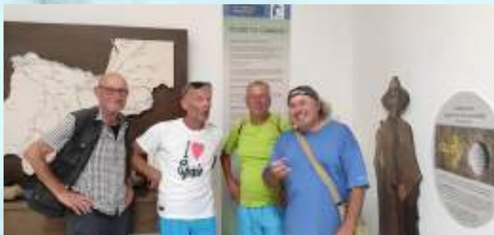
Visita de peregrin@s al Centro de Interpretación del Territorio y Sala del Camino Mozárabe