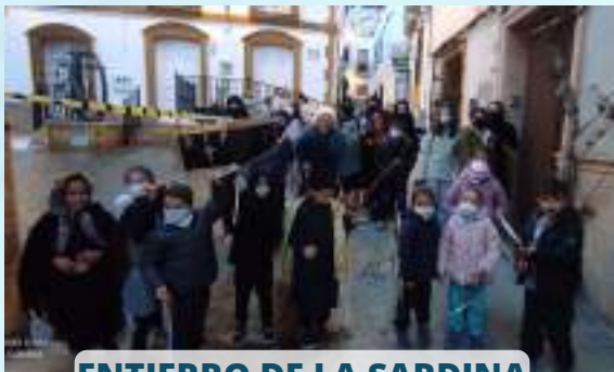
ENTIERRO DE LA SARDINA