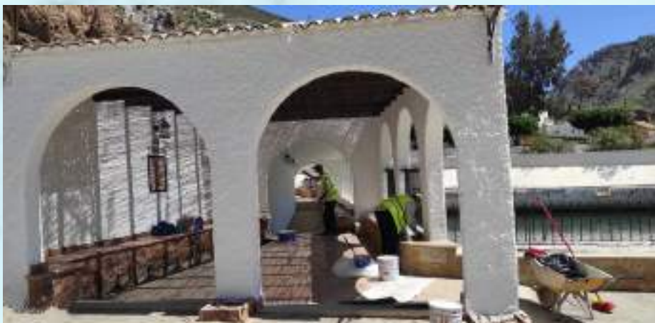
LIMPIEZA Y PLANTACIÓN