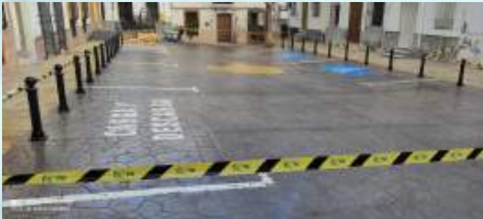
NUEVA IMPRIMACIÓN EN PLAZA DEL AYUNTAMIENTO