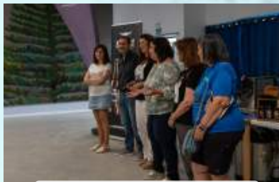
CATA DE VINOS, CERVEZA Y PRODUCTOS ARTESANALES