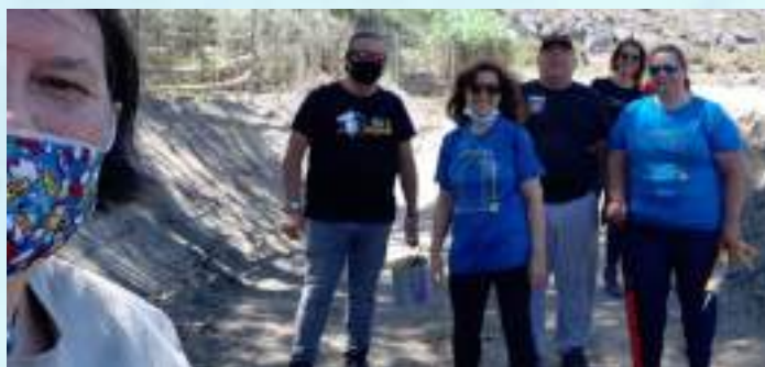
Apostando por la accesibilidad en nuestro Camino