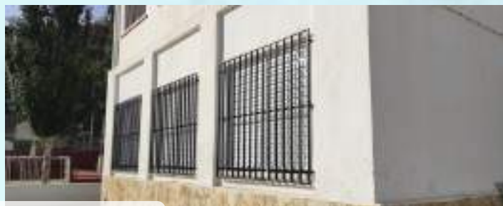
SUSTITUCIÓN DE VENTANAS