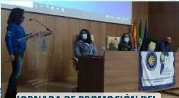
JORNADA DE PROMOCIÓN DEL CAMINO MOZÁRABE