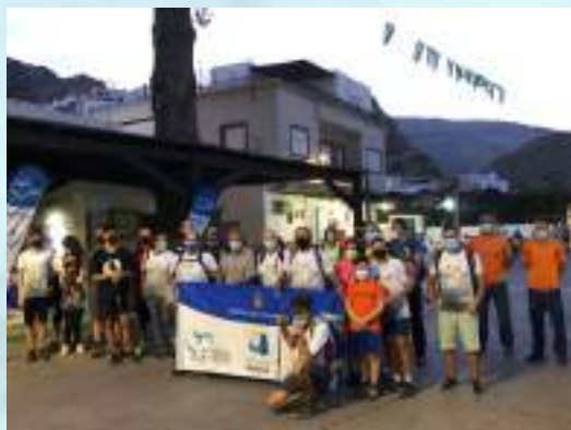
SENDERO DE LUNA LLENA