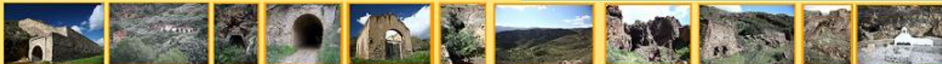
Cargadero Tres Amigos