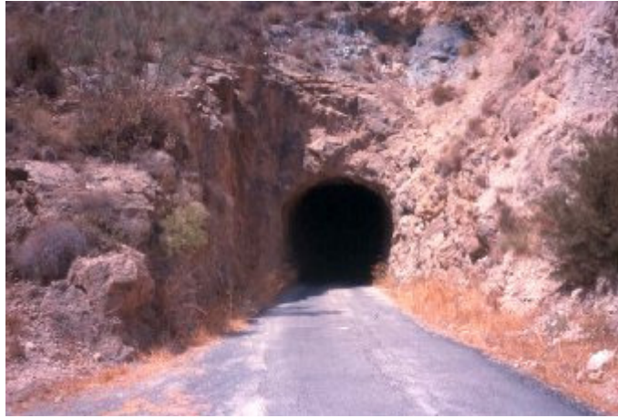
Ilustración 18: Antiguo trazado del ferrocarril de Bédar a Garrucha.