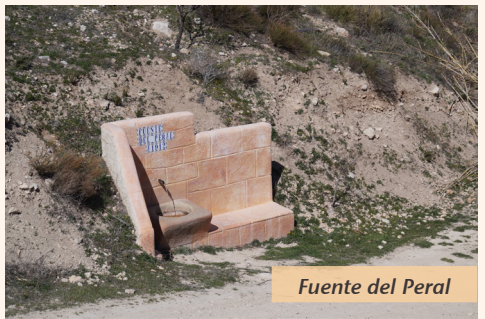
Fuente del Peral