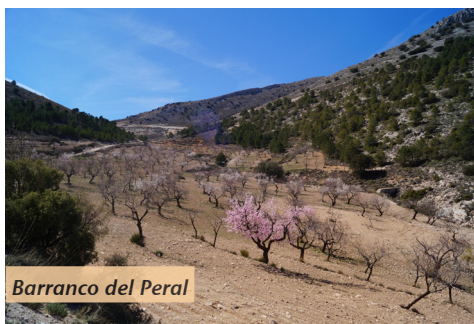
Barranco del Peral

Con un incalculable valor artístico y cultural, Vélez Blanco, es una de las poblaciones más emblemáticas de esta comarca. Abanderada por su castillo, guarda celosamente su pasado, vinculado al agua, al clima y a una historia reciente que lo ha hecho mundialmente conocido.