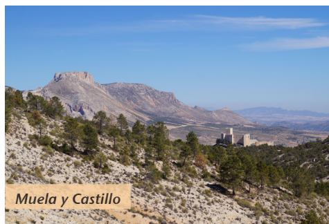
Muela y Castillo