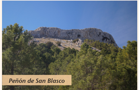
Peñón de San Blasco

Si en este punto giramos por la carretera hacia la derecha llegaremos a la zona alta de Vélez Blanco, a 5 minutos del Castillo.