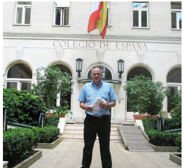
En la puerta del Colegio de España en París, invitado a una ponencia.

Para ello, y precisamente por ello, han sido constantes sus visitas a los archivos, especialmente al Ducal de Medina Sidonia y al Histórico Provincial de Almería; pero también el Diocesano de Almería, los parroquiales y, cómo no, el de Simancas, la Chancillería de Granada y los de la región de Murcia han sido sus centros de referencia para la búsqueda de documentos. En este sentido es preciso poner de relieve su decidido apoyo a una iniciativa muy importante para la comarca velezana, para parte de la región de Murcia y, de manera indiscutible, para la historia de Almería. La digitalización del fondo Vélez del Archivo