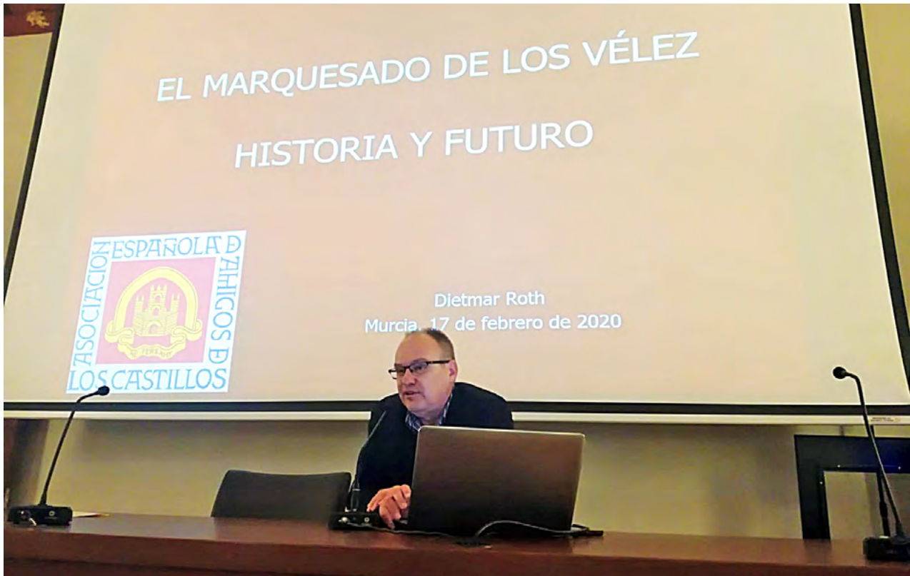
Conferencia sobre el marquesado de los Vélez en Murcia.

común sus investigaciones sobre núcleos de interés para los habitantes de las comarcas. Los temas abordados fueron el territorio 39 (Huéscar, 2016), el agua y su aprovechamiento (Vélez Blanco, 2017), la puesta en valor de los castillos (La Calahorra, 2018) y el paisaje (Purchena, 2019).