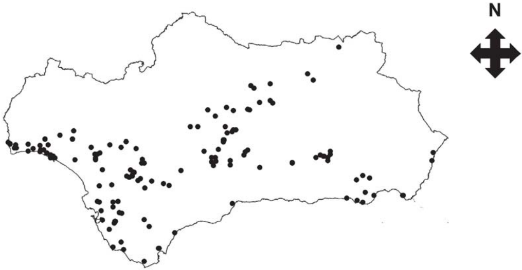
FIG. 3.- Localización geográfica de los humedales incluidos en el Inventario Abierto de Humedales de Andalucía.