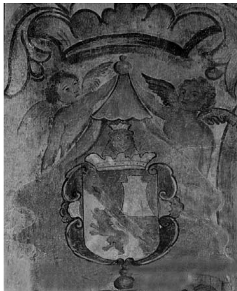
ESCUDO DE LOS CASTILLA. IGLESIA DE LA VILLA DE GOR (GRANADA)