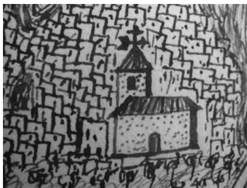
EN EL DIBUJO DE ALBOLODUY QUE APARECE EN EL CATASTRO DEL MARQUÉS DE LA ENSENADA, AÚN SE APRECIA LA TORRE DEL BENEFICIADO ANEJA A LA IGLESIA.