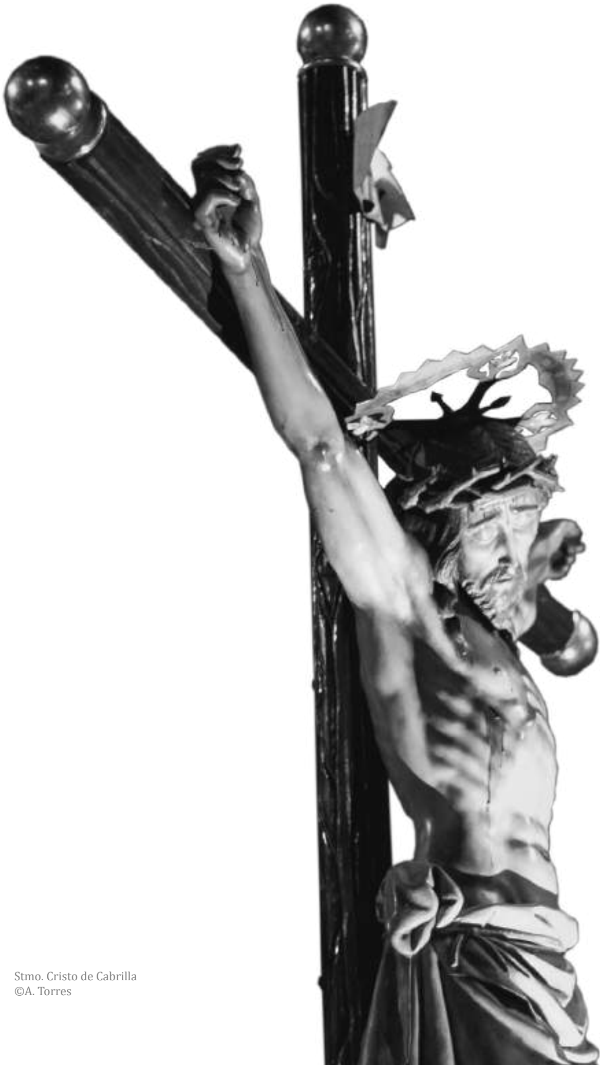
Stmo. Cristo de Cabrilla