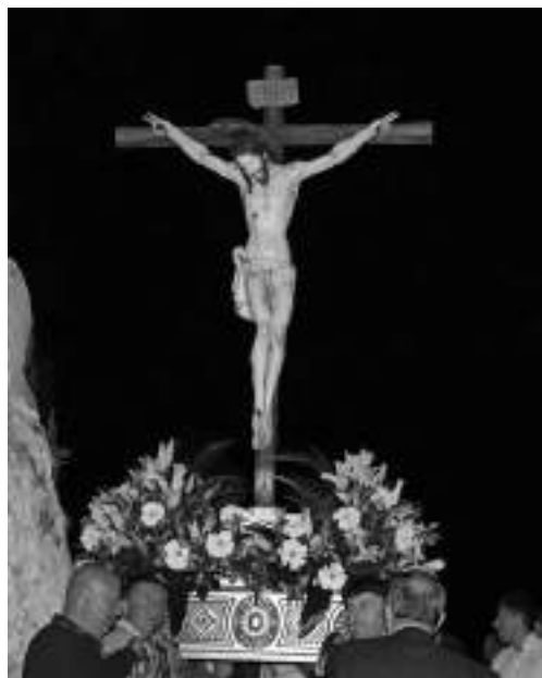
Viacrucis con la imagen del Cristo de la Misericordia en Río Chico