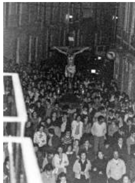
Viacrucis del Cristo de la Expiración a su paso por la calle Faura a comienzos de los años ochenta.

El viacrucis de la rambla del Higueral incluía a las barriadas de los Torres y los Rodríguez. Comenzaba en la calle que discurría paralela a la rambla y daba acceso a estas barriadas, y en él las cruces estaban pintadas sobre el muro de contención de la rambla, finalizando el recorrido en el cortijo de los Paterneros. En el anejo del Cortijuelo el viacrucis comenzaba en el cortijo de los Notáez, y el señalamiento de las estaciones alternaba cruces de madera empotradas en las paredes de las casas, con otras pintadas sobre los muros y balates. Los vecinos solían denominar a estos rezos la "Visacla" (deformación de "vía sacra"), y de ellos se encargaba, mediada la pasada centuria,