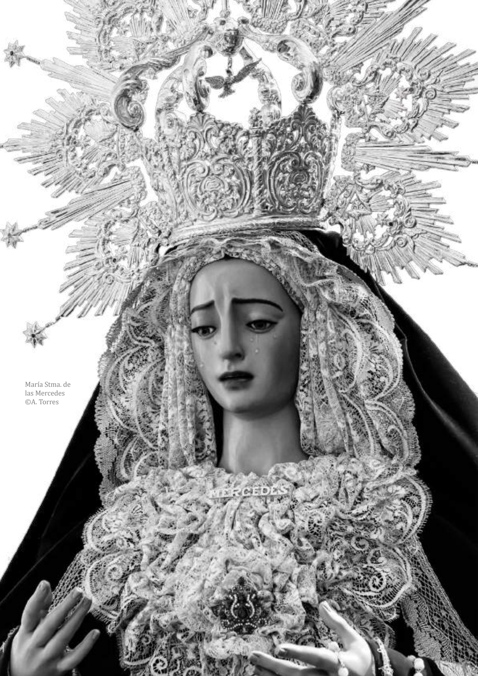
María Stma. de las Mercedes ©A. Torres