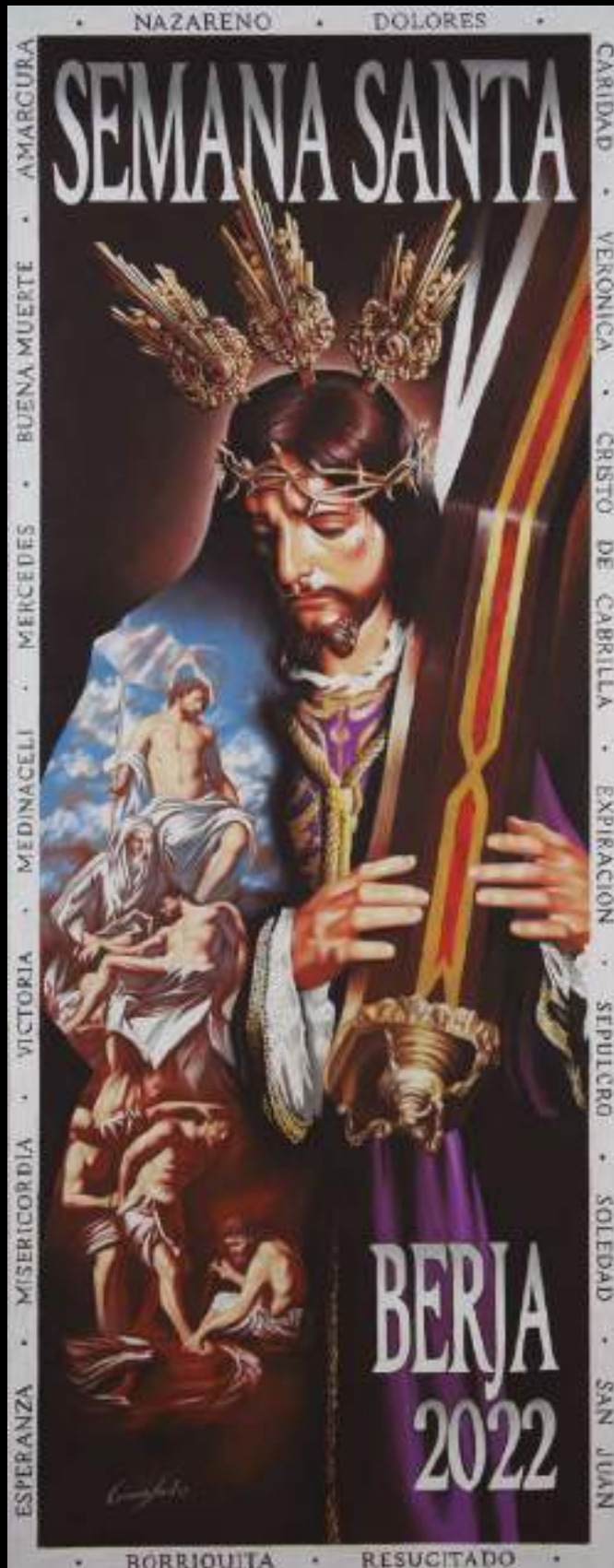
Cartel de la Semana Santa de Berja 2022 Autor: Miguel Carmona Montes