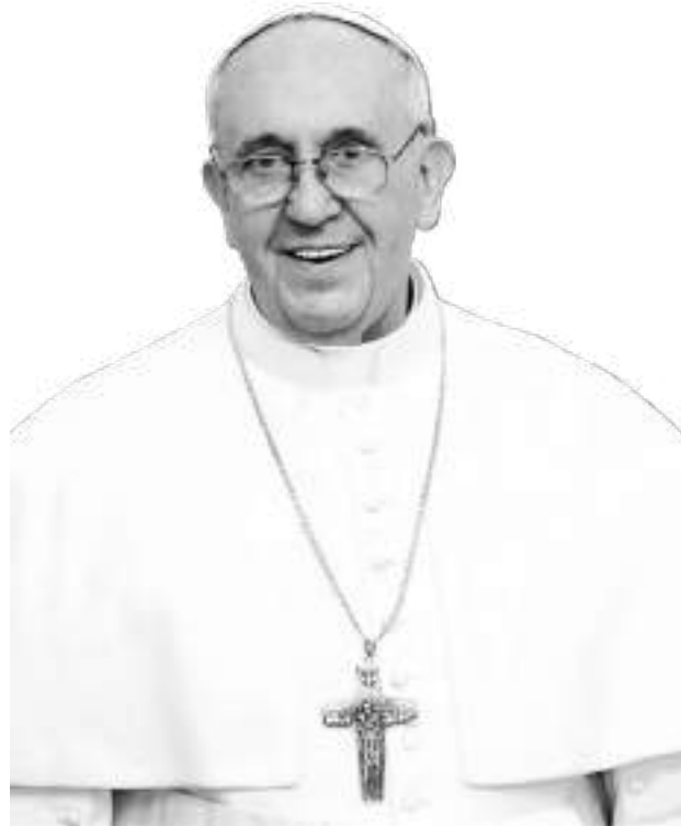
Su Santidad el Papa Francisco

"No nos cansemos de hacer el bien, porque, si no desfallecemos, cosecharemos los frutos a su debido tiempo. Por tanto, mientras tenemos la oportunidad, hagamos el bien a todos" (Ga 6,9-10a)