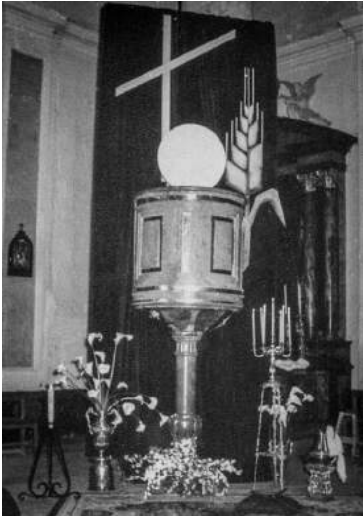
Monumento en la Parroquia de la Anunciación Principio de los años 70 ©José Durán Barrios