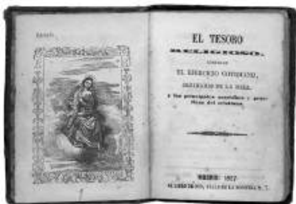
"El tesoro religioso" fue el ritual utilizado para los viacrucis de Peñarrodada.