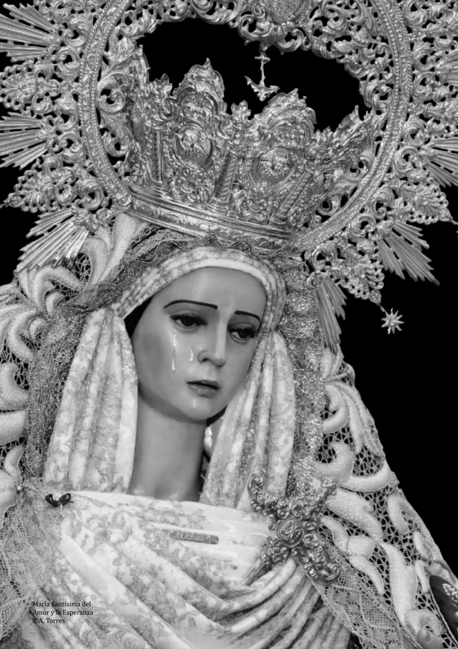
María Santísima del Amor y la Esperanza