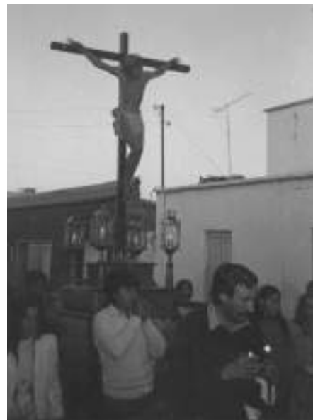
Viacrucis en San Roque en los años ochenta

La barriada de Alcaudique contó con un recorrido establecido desde muy antiguo, que incluso ha dado lugar al topónimo “El Calvario”, situado en la parte alta del Montivel. Al tratarse de una de las parroquias más grandes, el rezo del viacrucis siempre fue dirigido por sacerdotes. El recorrido coincidía en gran medida con el de la procesión de San Isidro, añadiéndosele la subida hasta el Montivel, bajando después por el camino que pasaba junto al cortijo de la Fuente hasta llegar a la Peñarroera. Para señalar las estaciones se utilizaban pequeñas cruces de madera o se pintaban en las paredes. A mediados del pasado siglo el cortejo se encabezaba por los hombres, que portaban algunos faroles, caminando tras ellos las mujeres, vistiendo todos de riguroso luto.