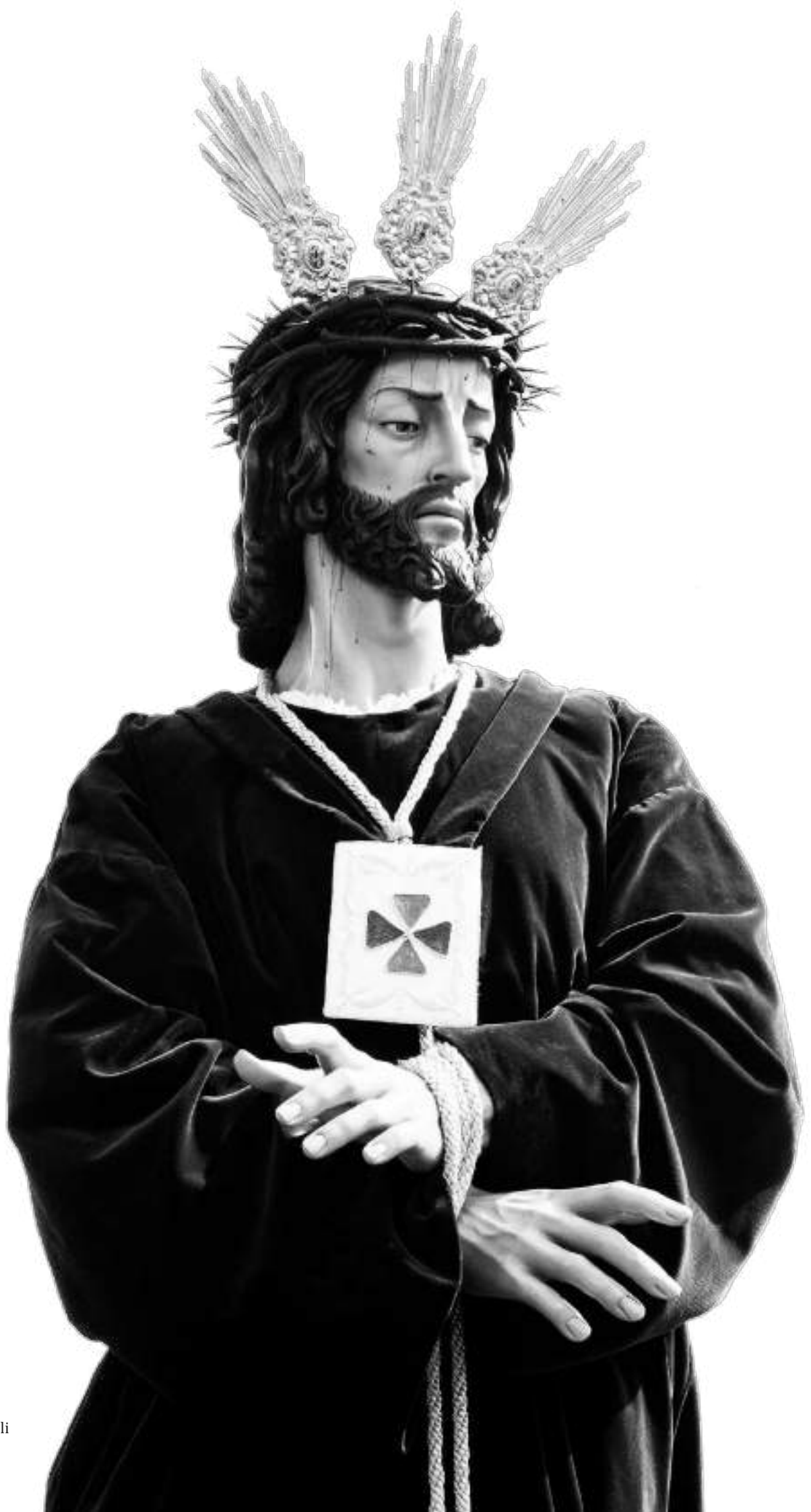
Nuestro Padre Jesús Cautivo de Medinaceli