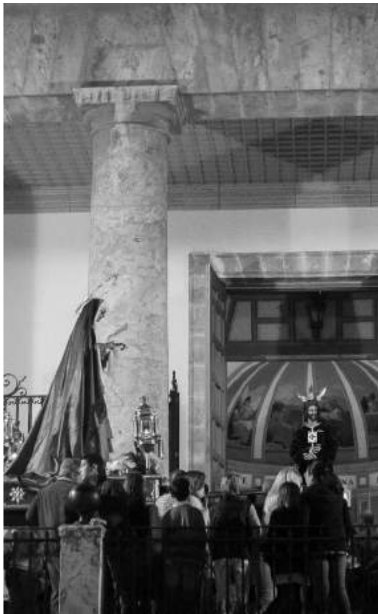
Via Crucis de traslado de las imágenes de la Cofradía del Cautivo de Medinaceli. Año 2016