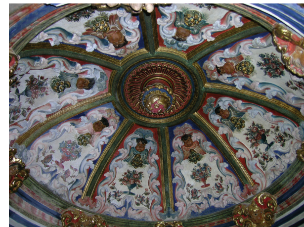
Cubierta del Camarón de la Iglesia de Benecid

Lugar: Salón de Plenos del Ayuntamiento de Huércal-Overa.