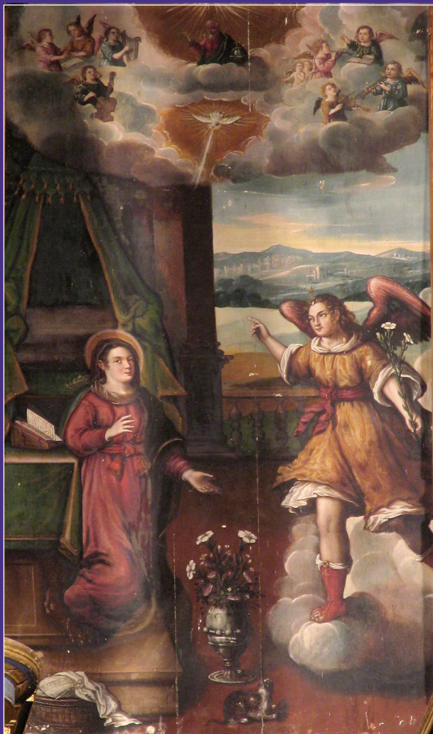
Anunciación: Retablo convento de San Luis de Vélez Blanco