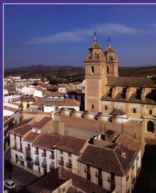
Iglesia de la Encarnación y casco de Vélez Rubio