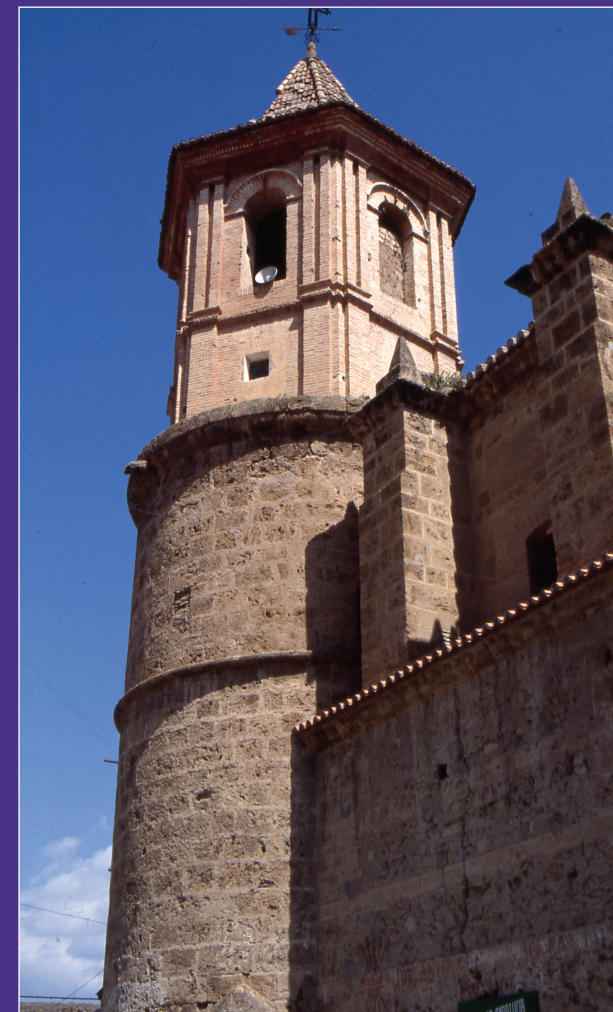
Convento de los Agustinos de Huéctija

ALMERÍA, BERJA, HUÉRCAL-OVERA, TÍJOLA y VÉLEZ RUBIO