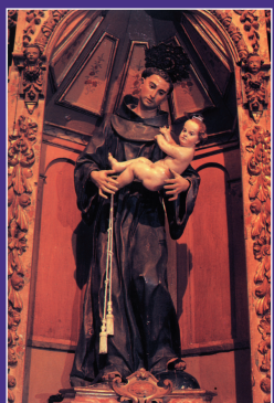
San Antonio de Padua de Francisco Salzillo. Iglesia de la Encarnación de Vélez Rubio