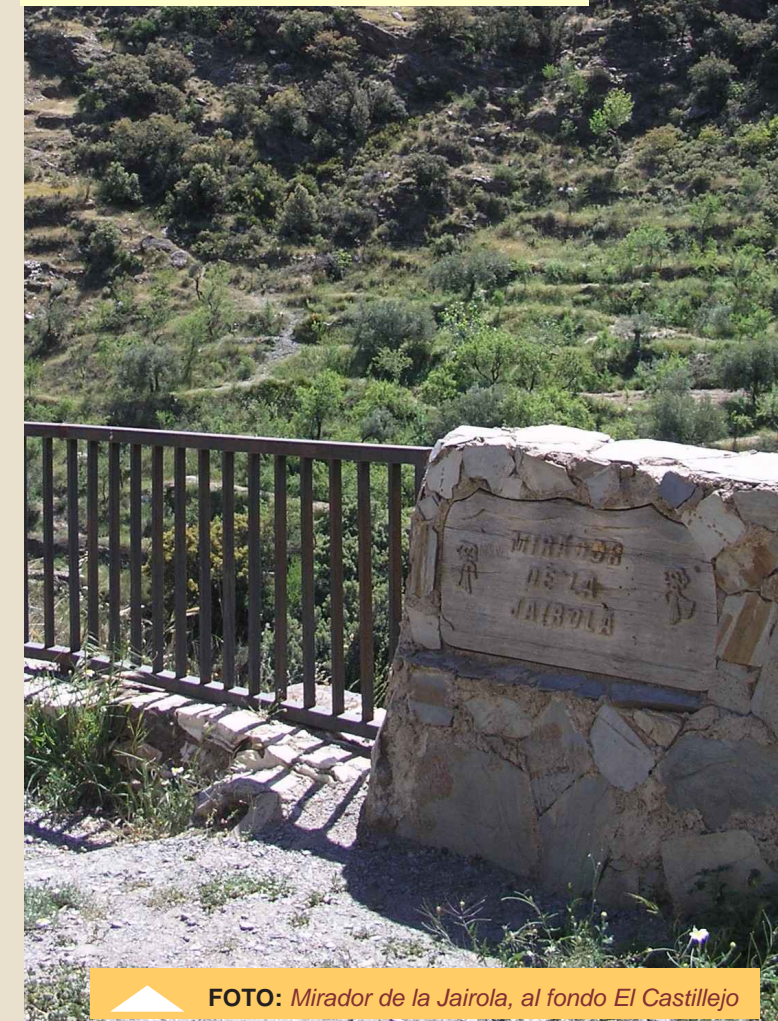
FOTO: Mirador de la Jairola, al fondo El Castillejo