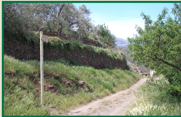
Llegando al Cortijo de los Monjos