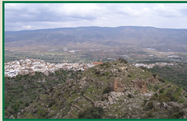
Vista del Castillejo y de Abrucena