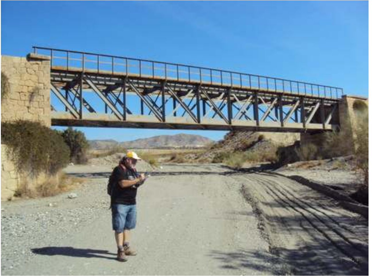
SUPERVISION DEL SENDERO