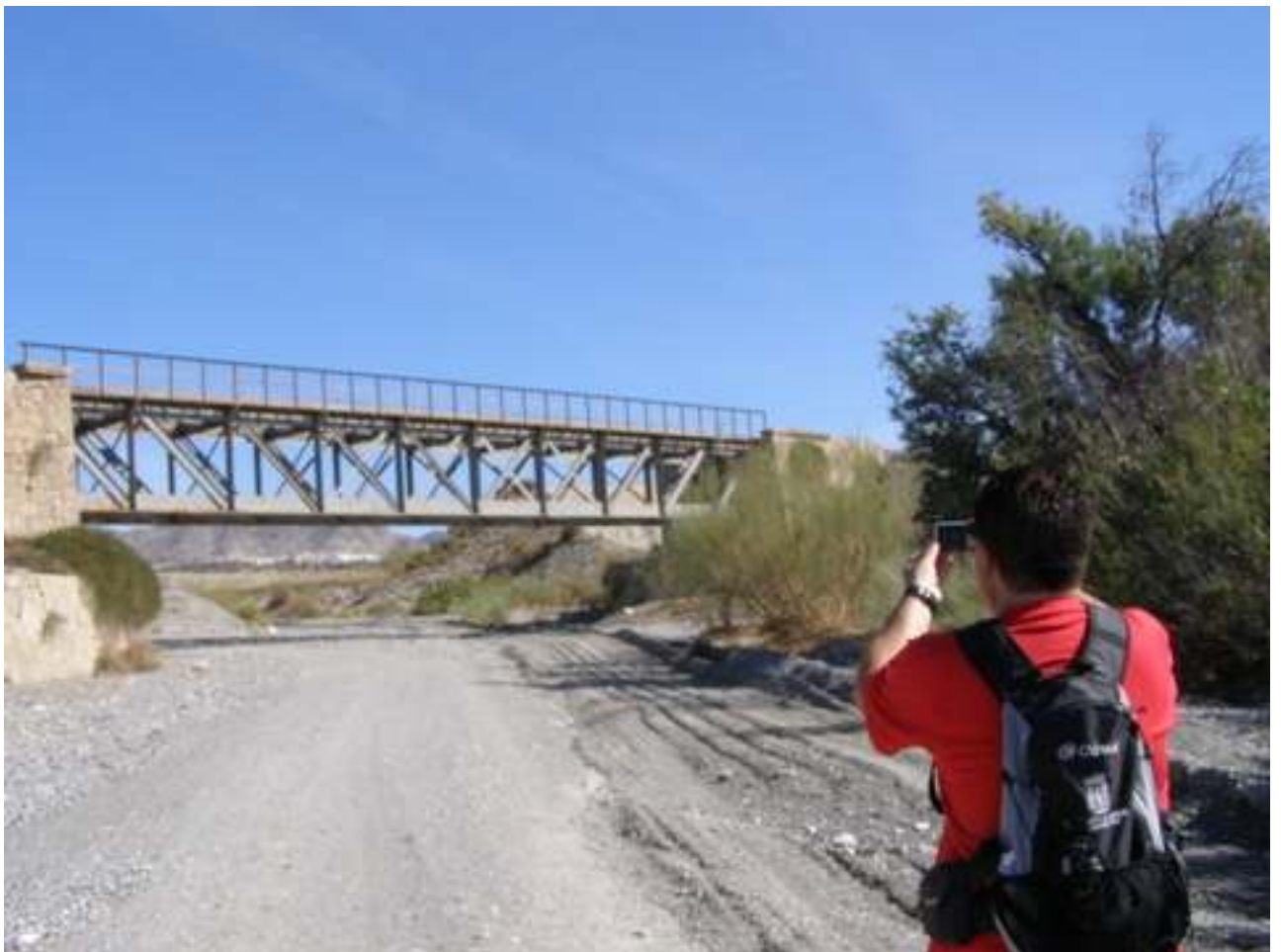
SUPERVISION DEL SENDERO