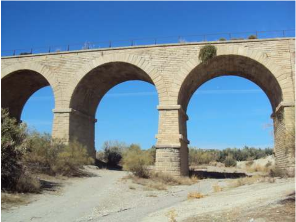
PUENTE DE LOS 3 OJOS