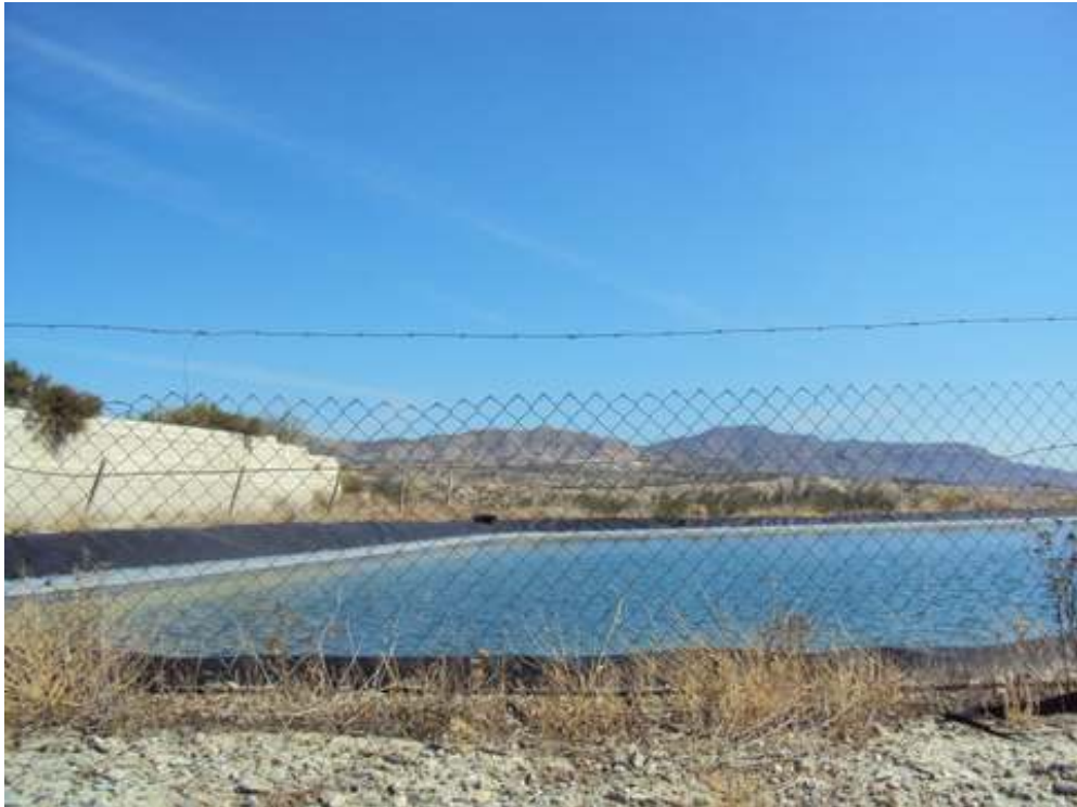
CAMINO DE LA RUTA