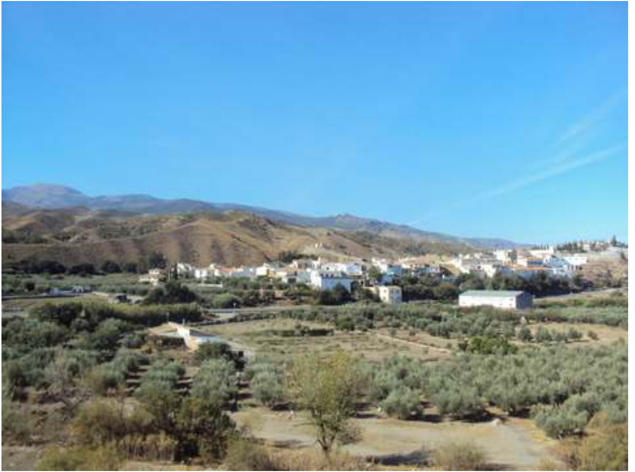
MUNICIPIO DE ARMUÑA