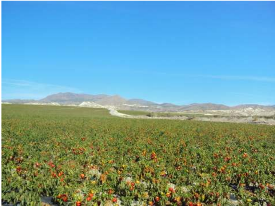
PLANTACIÓN DE PIMIENTOS PARA LAS CONOCIDAS FRITADAS DE ARMUÑA