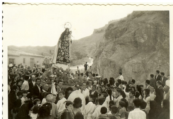
Bajada de la Virgen del Carmen. 1957.

-20:45. Vela de la Virgen. En las almenas, y como es tradicional, se vela a la Virgen del Carmen durante toda la noche hasta por la mañana cuando tendrá lugar la solemne Eucaristía (7:00).