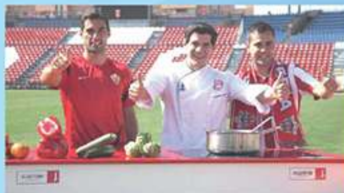
Imagen de la U.D. Almería