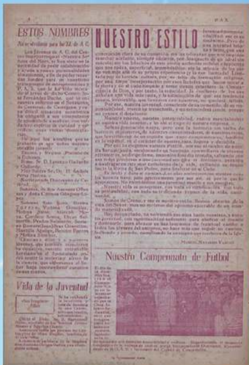
Página de la revista Pax de 27 de agosto de 1950

Causó baja en el colegio de médicos de Almería el 10-9-1969, fecha de su muerte.