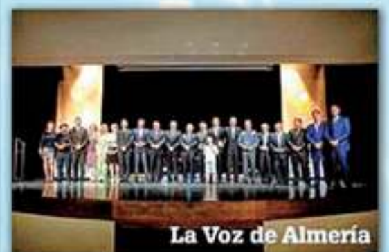
Macoel fue anfitrión de la gala