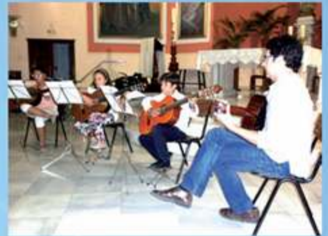
Grupo de alumnos de la Escuela de Música tocando la guitarra