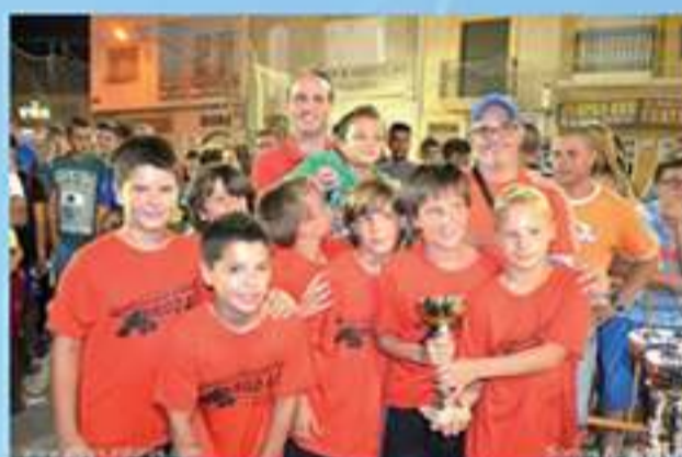
Campeones categoría benjamin Construcciones Diego