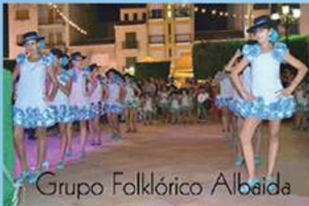
Grupo Folklórico Albaida