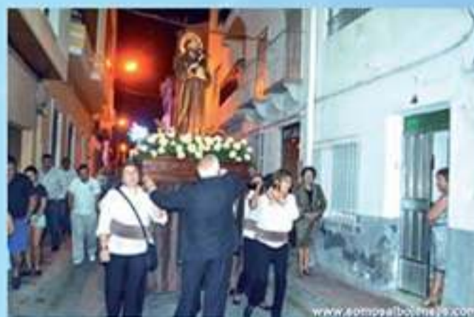
La procesión de San Francisco justo ante la puerta de Concepción