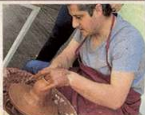
EN VIVO los alfareros elaboraron piezas para los niños.