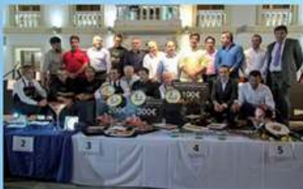
Miembro del Jurado en la Fiesta del Jamón de Serón