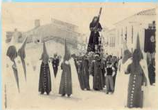
Imagen del Nazareno en la Plaza de los Dolores. Años 40