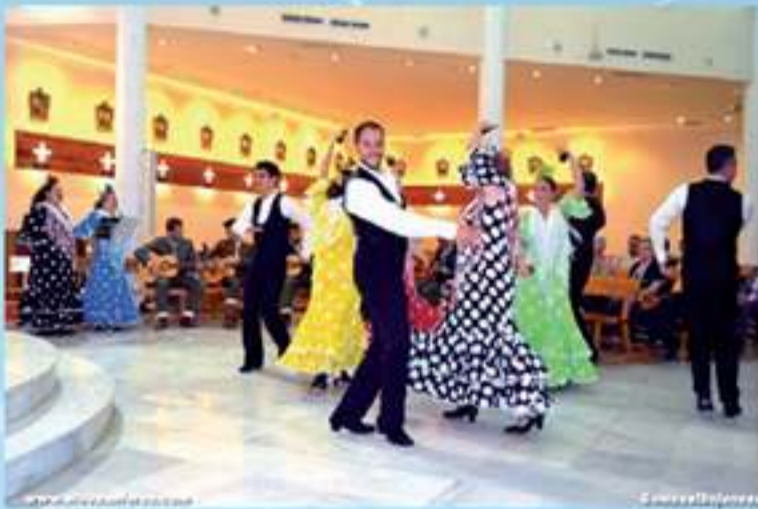
Grupo Folklórico Municipal de Granada