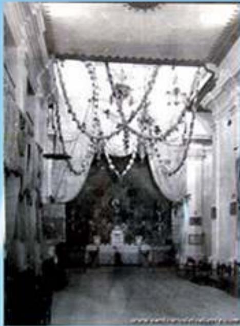
Interior de la antigua Iglesia de La Concepción, ornada con motivo de la visita de la Virgen del Saliente