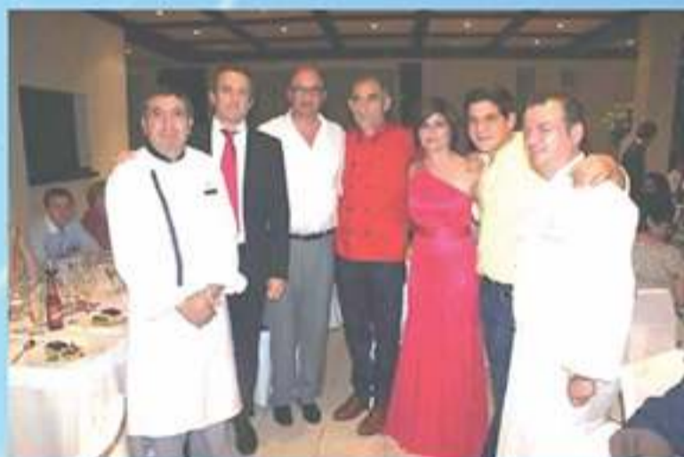
Colaborando en la Gala Benéfica "Arte y Sabor", para la investigación de la Retinosis Pigmentaria