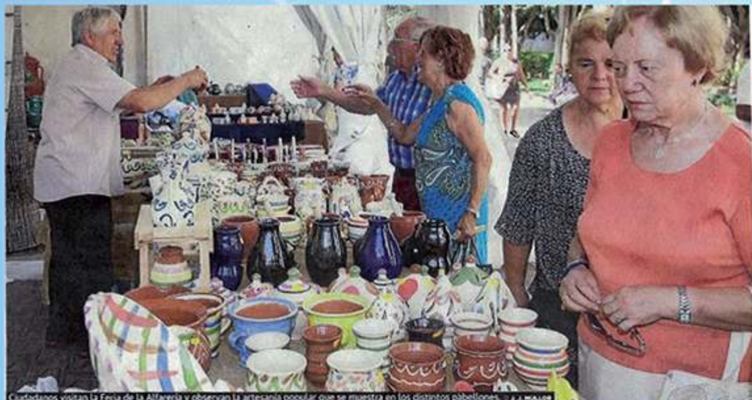
Ciudadanos visitan la Feria de la Alfarería y observan la artesanía popular que se muestra en los distintos pabellones.