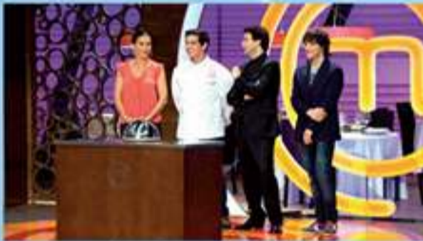
Invitado en la semifinal de la II Edición