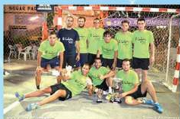
Baloncesto. Categoría senior Cafetin-Eden (Garrucha)