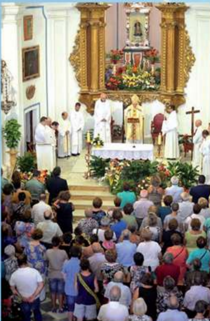
Santa Misa concelebrada y presidida por el obispo de la Diócesis