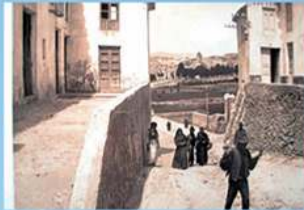
Cuesta de La Loma Principio del Siglo XIX