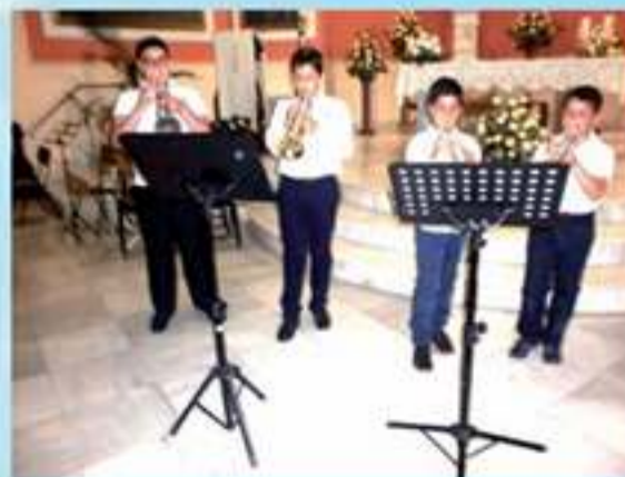
Alumnos del Conservatorio Sor Emilia Peña tocando la trompeta