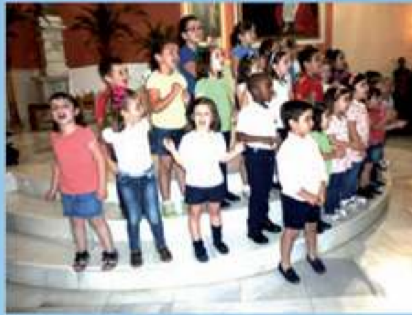
Coro infantil de la Escuela Municipal de Música de Albox