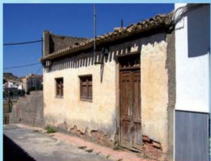
Escuela de D. Torcuato