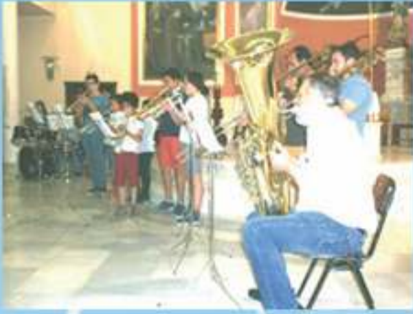
Alumnos de la Escuela de Música tocando instrumentos de viento