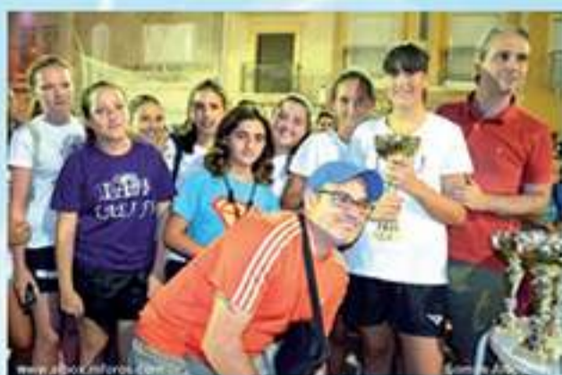
Campeonas categoría femenina L.A.E.J.