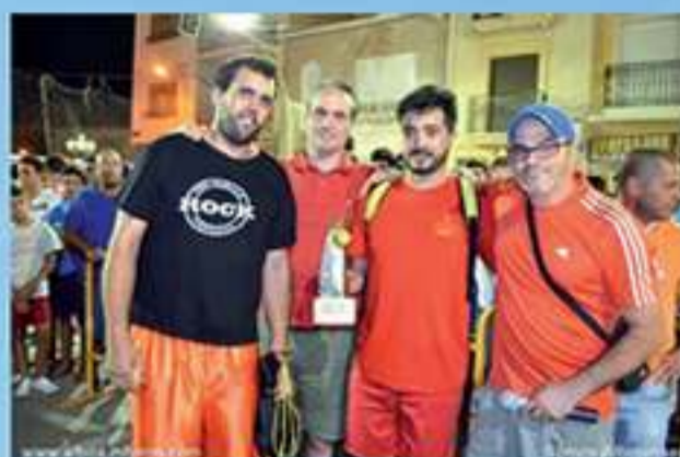
Baloncesto. Campeón cadete Macafi