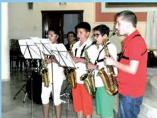
Alumnos de la Escuela de Música tocando saxofones