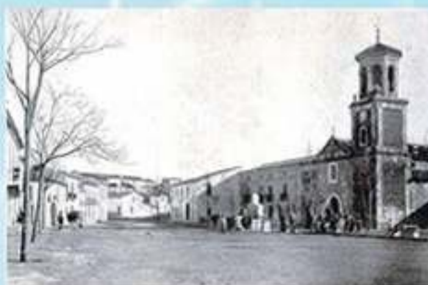
Albos (Almóciga). Plaza de San Francisco Bartolomé A. Mallén-Estigar, (ca. 1909) 1 fot. y 13 v. 18 cm. Portafolio de Espada 23 . -- R. 7443 A . -- P-795