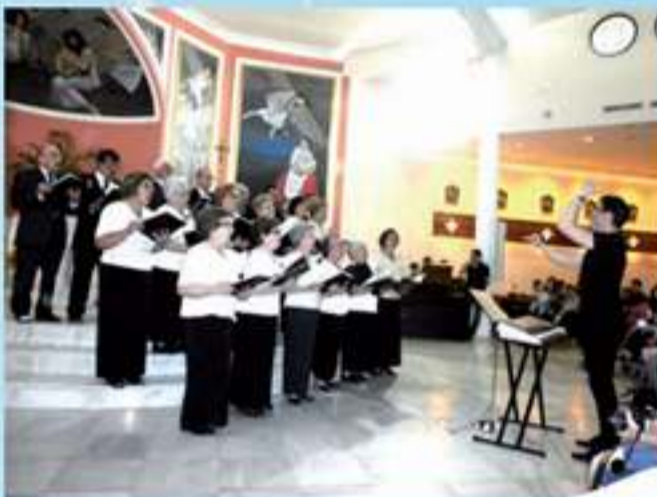
Coral La Milagrosa