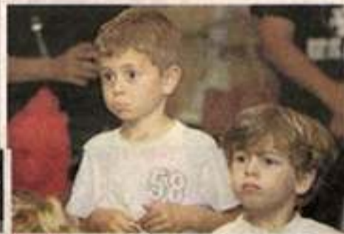
EMOCIÓN en los rostros de los niños escuchando relatos.