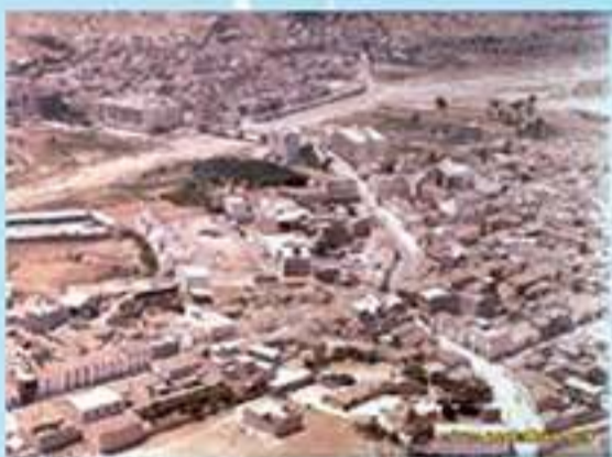
Panorámica de La Loma. Año 1976