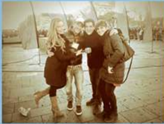
En el Macrocasting de la II Edición. Barcelona