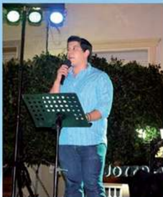
Pregonando las fiestas San Francisco 2013