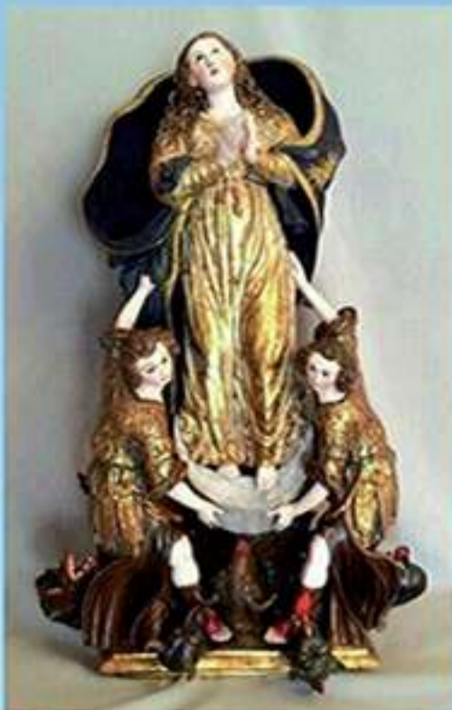
Virgen del Saliente restaurada