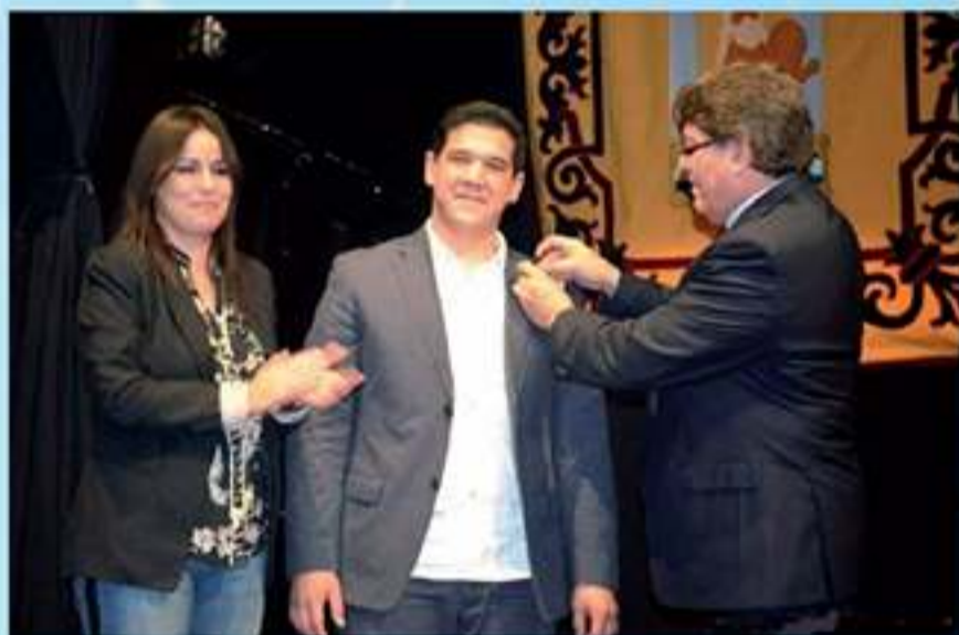
Imposición del Escudo de Oro de la Villa