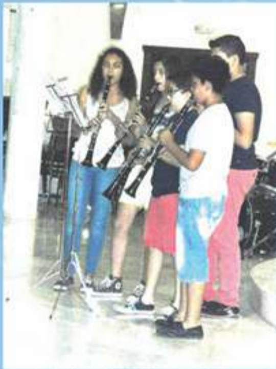
Grupo de clarinetes de la Escuela Municipal de Música de Albox