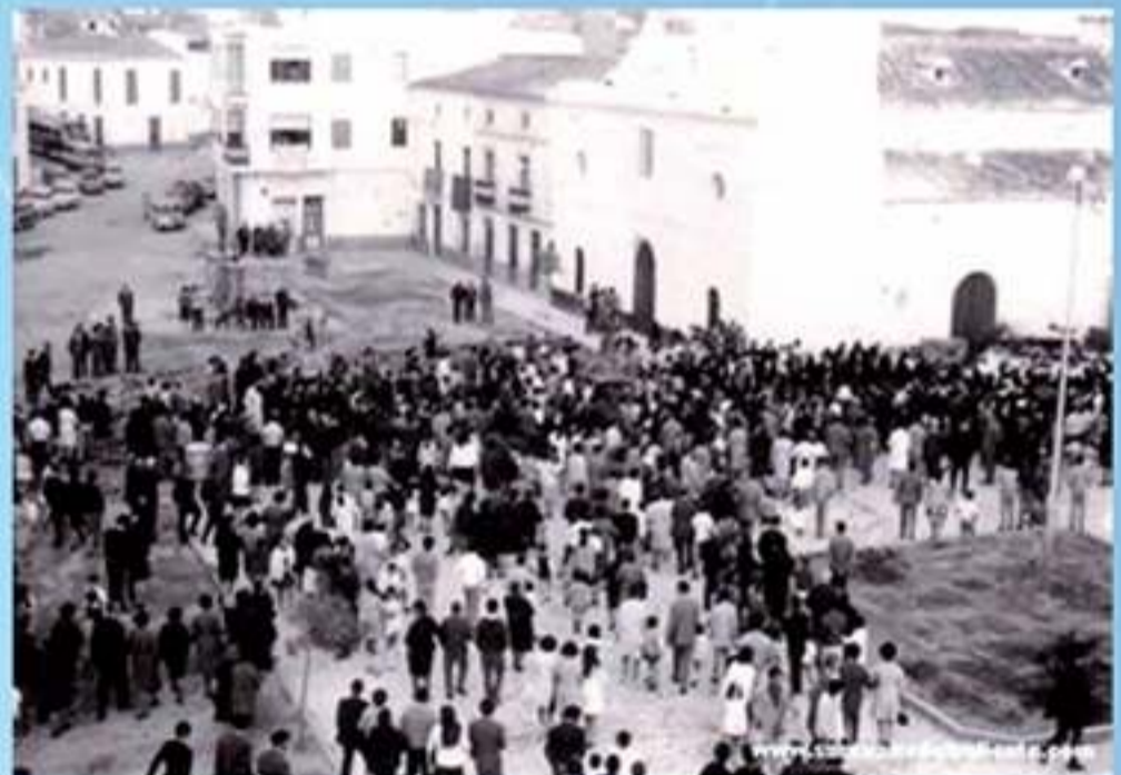
Llegada de la Virgen del Saliente a la Iglesia de la Loma Plaza San Francisco. Año 1970