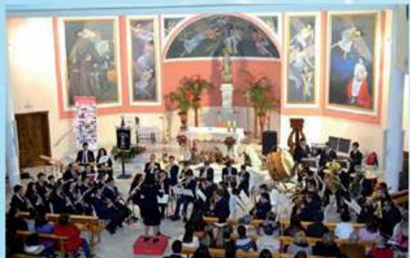
Banda de Música de Albox