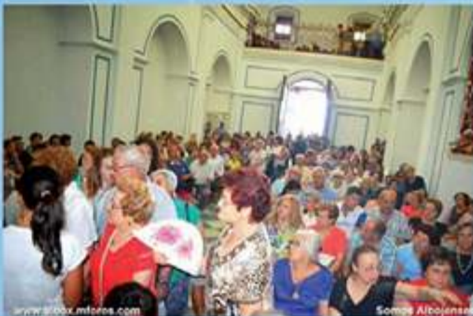
Cientos de devotos se dieron cita en El Saliente para venerar a La Pequeñica