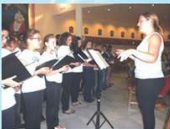
Coro juvenil del Conservatorio Sor Emilia Peña