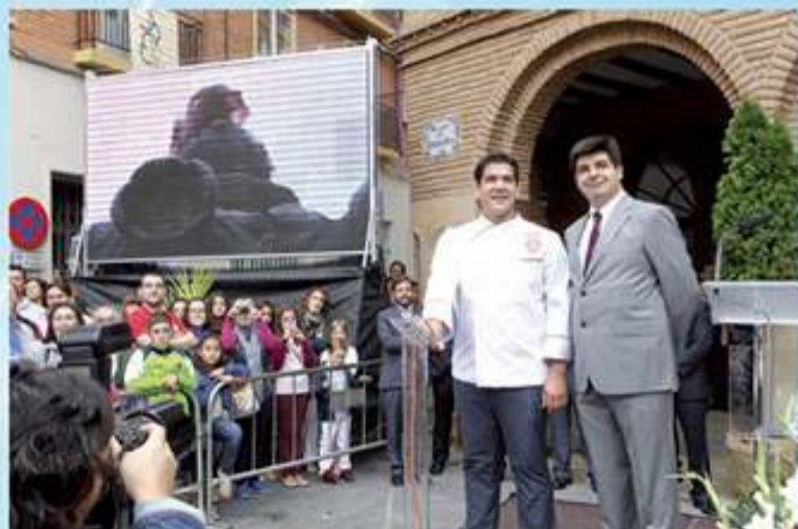
Invitado de honor en la Fiesta del Vino de Cariñena (Zaragoza)