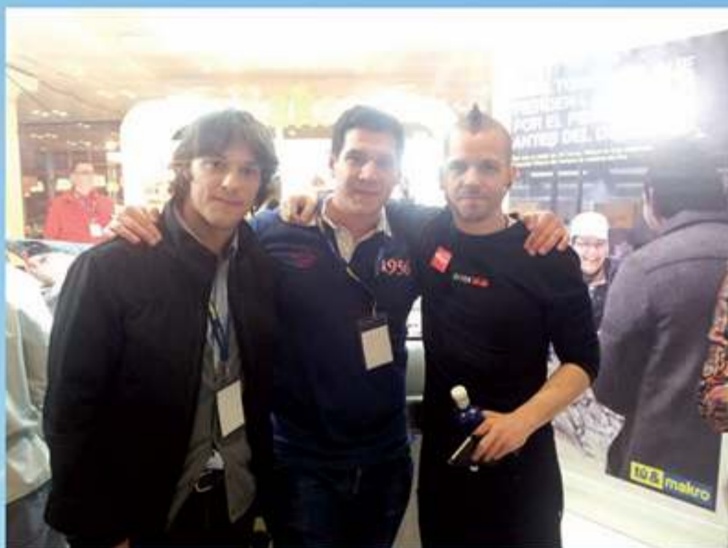
Junto a Jordi Cruz y David Muñoz, tres estrellas Michelin Madrid Fusión