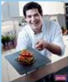
Publicitando productos ISABEL