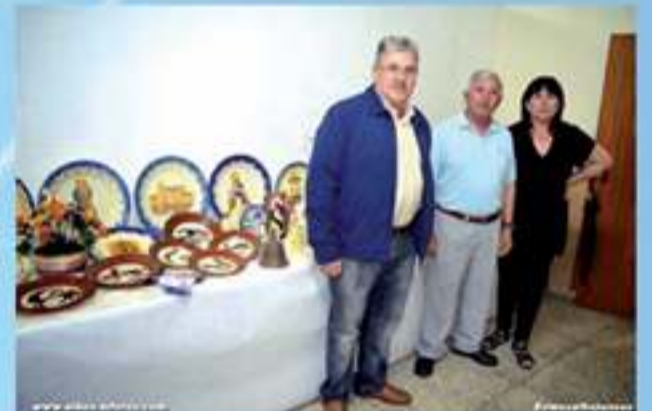
Exposición de cerámica de Los Puntas