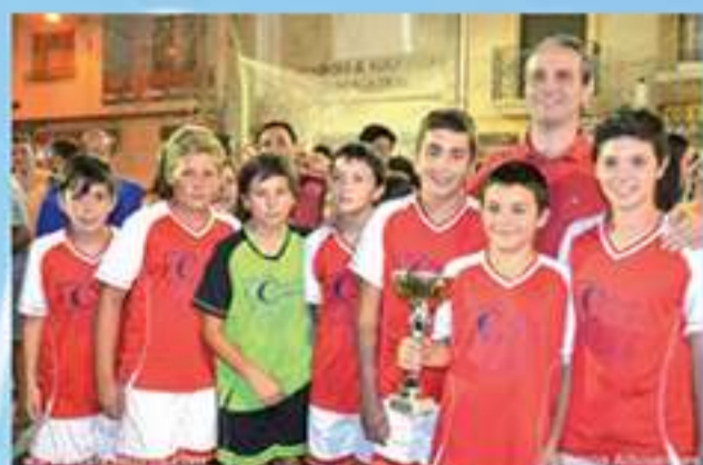
Campeones categoría alevín Real Albex