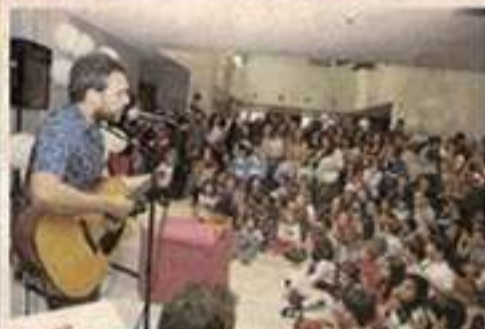
CUARENTACENTOS al que asistieron más de 300 personas.