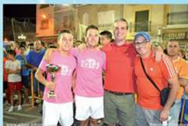
Campeones categoría cadete Viajes Athenea