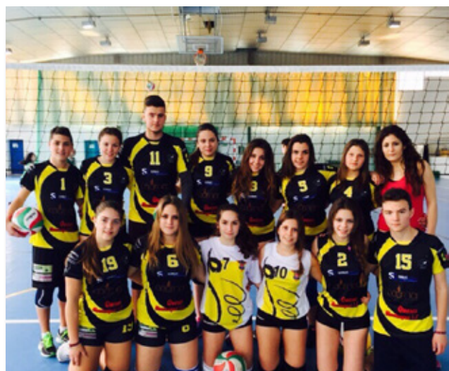
PREMIO AL DEPORTE EDM VOLEIBOL JUVENIL SORBAS

CURSO DE INGLÉS PARA LA PREPARACIÓN DEL B1. INFORMACIÓN E INSCRIPCIÓN EN EL ÁREA DE CULTURA DEL AYUNTAMIENTO DE SORBAS.