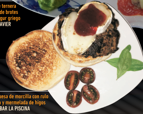
Hamburguesa de morcilla con rulo de cabra y mermelada de higos BAR LA PISCINA

*Suplemento de 0,50€ en las tapas de la Ruta