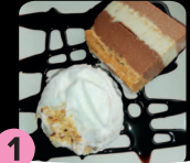
1 Tarta de 3 chocolates con coco CAFÉ BAR LA PISCINA