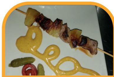
Brocheta de solomillo con salsa de mango BAR LA PISCINA