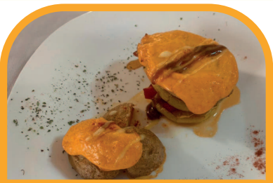
Mil hojas de manzana con solomillo en salsa gaucha RESTAURANTE EL FOGÓN