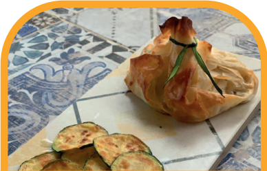
Saquito relleno de salsa candela PUB CANDELA