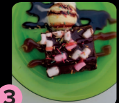
3 Tarta de la abuela y la niña con helado de plátano CAFÉ BAR SAN JAVIER