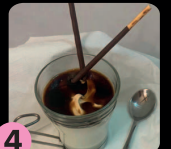
4 Café creme especial Fogón RESTAURANTE EL FOGÓN