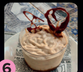
6 Mousse de galleta y caramelo PUB CANDELA