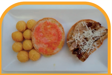
"Espacio". Tiras de lagarto ibérico con parmesano y salmorejo BAR SAN JAVIER