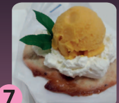
7 Dulce Inés con crema mascarpone y helado de mango CAFETERÍA CAYMAR