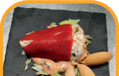
Piquillos de ahumados RESTAURANTE CUEVAS DE SORBAS