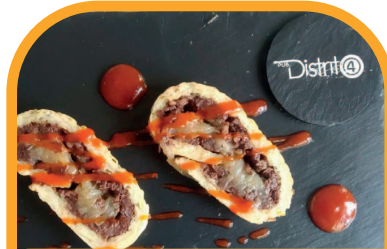
Rulo de patata relleno de morcilla y cebolla caramelizada PUB DISTRITO 4