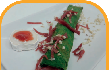
Crepes de espinacas con mousse de ajoblanco CAFETERÍA CAYMAR