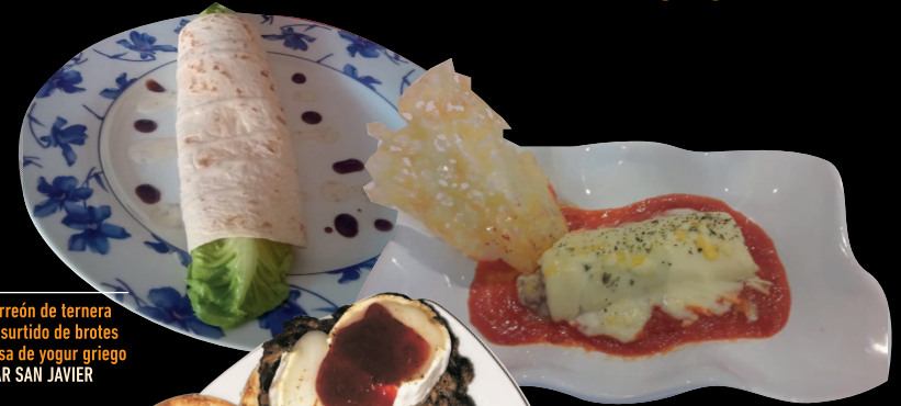
Kebab chorreón de ternera y pollo con surtido de brotes tiernos y salsa de yogur griego CAFÉ BAR SAN JAVIER

VOTA TU TAPA FAVORITA y participa en el sorteo de premios