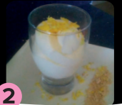
2 Mousse de limón PEKENEKES