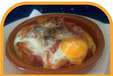
Huevos a la flamenca CAFÉ BAR PEKENEKES