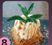
8 Milhojas de higo y turrón con delicias de almendra y café RESTAURANTE CUEVAS DE SORBAS

Si completas el rutero de las tapas y consumes los 8 postres podrás votar por el que más te guste y entrar en el sorteo de un PREMIO ESPECIAL POSTRES valorado en 160€.