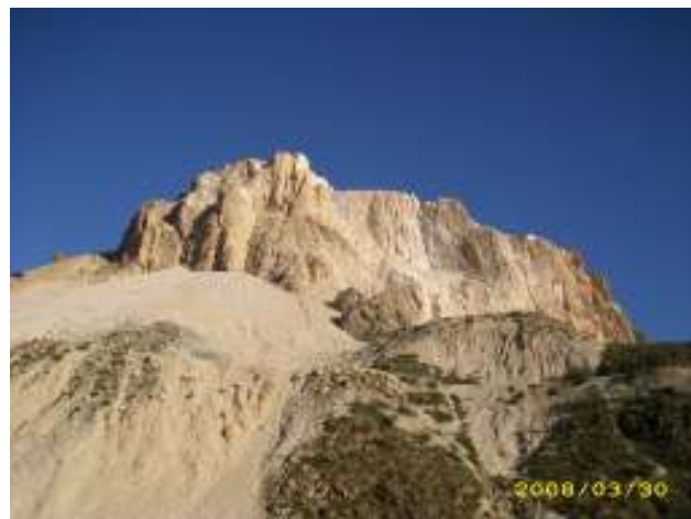
CANTERA DE MARMOL