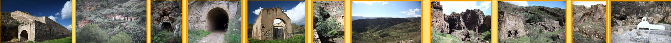
Cargadero Tres Amigos Mina Pobreza Mina Alerta Tunel del Servalico Cocherón de la Locomotora Túnel de la Higuera Barranco Baeza San Manuel y Vía Vulcano Tolvas de Vulcano Hoyo de Júpiter Fuente de Serena