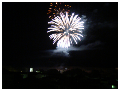
Castillo de fuegos