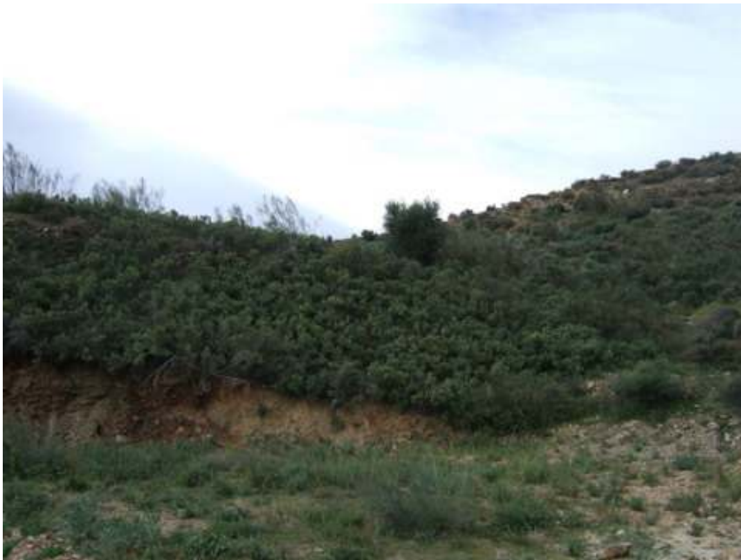
JARAL (CITUS ALBUS)