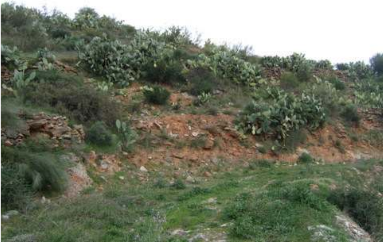
CHUMBERAS COMO FIJADORAS DEL SUELO