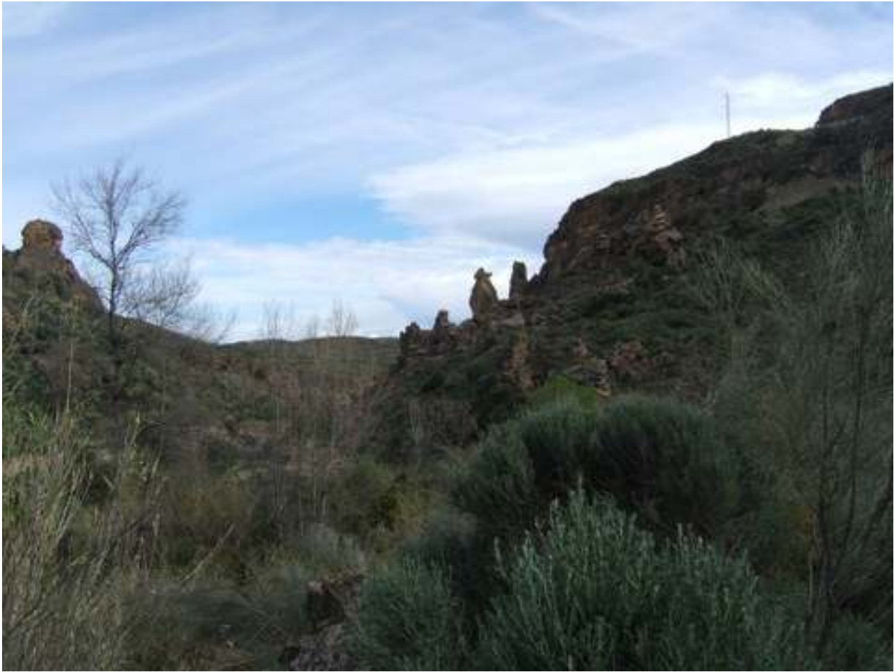
VISTAS DE LA RUTA