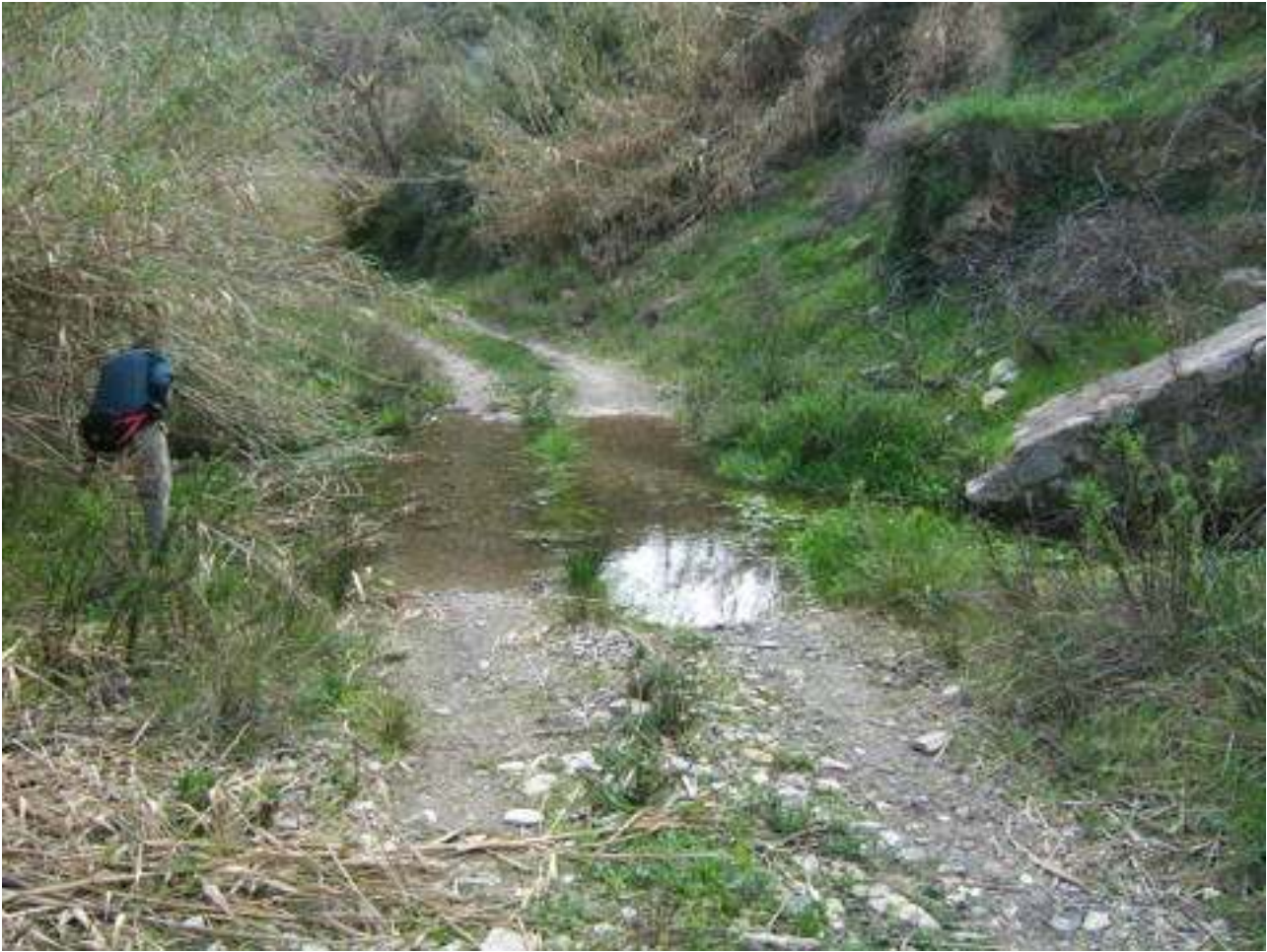
PARTE DE LA RUTA