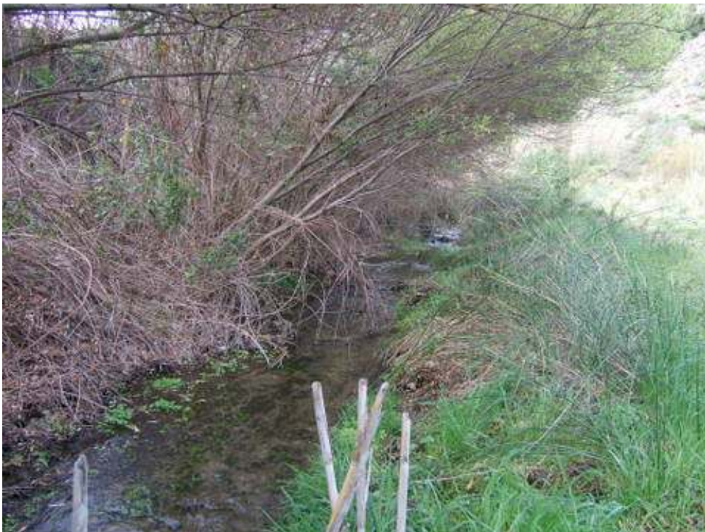
MIMBRERAS EN RÍO LOS MOLINOS