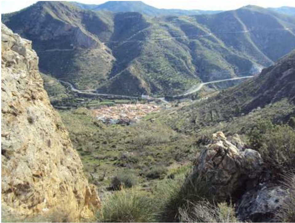
-VISTAS DESDE LA RUTA-