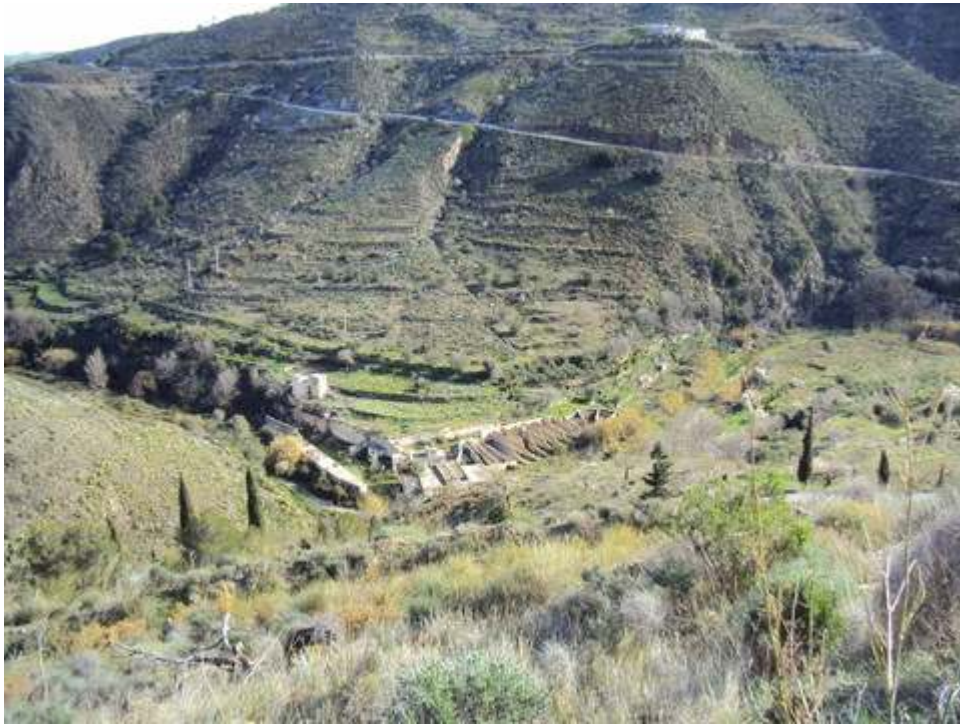
-PARTE DE LA RUTA-