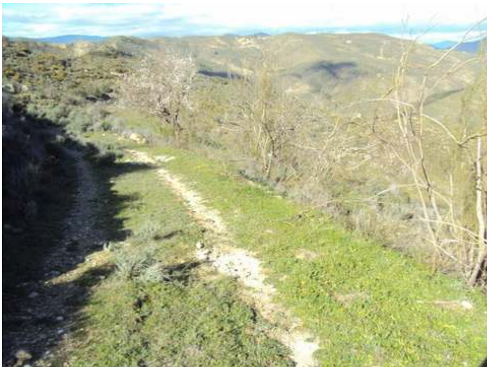
-PARTE DE LA RUTA-