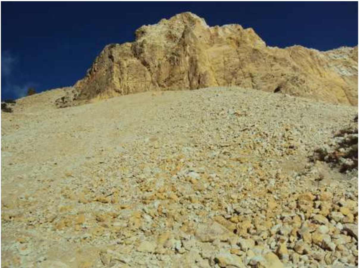
-VISTAS DE LA RUTA-