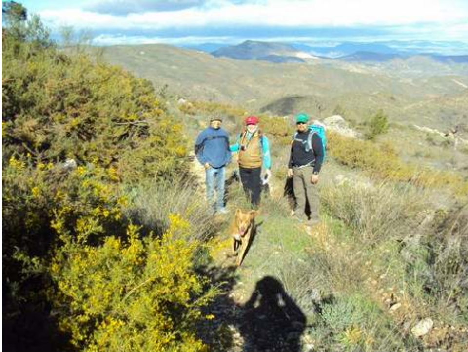
-SUPERVISANDO LA RUTA-