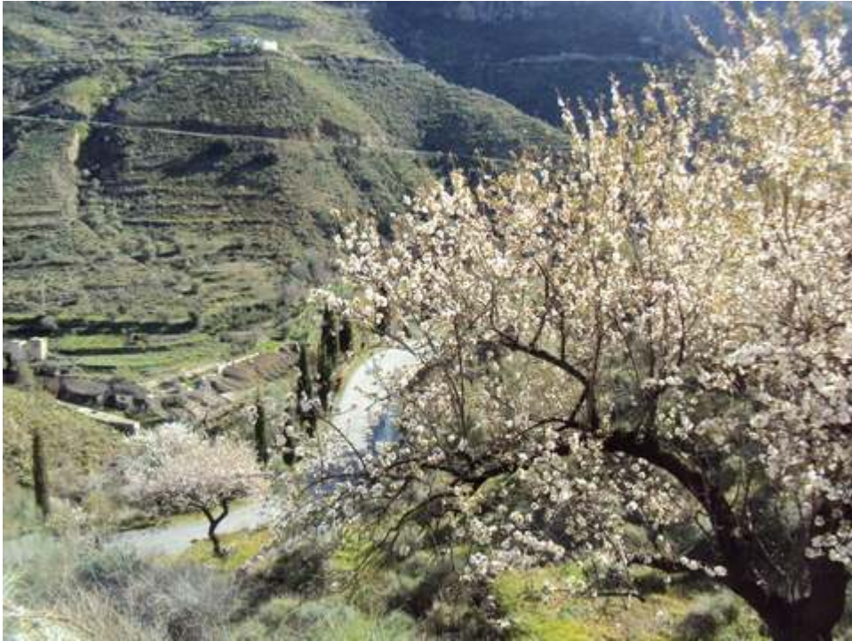
-ALMENDRO EN FLOR-