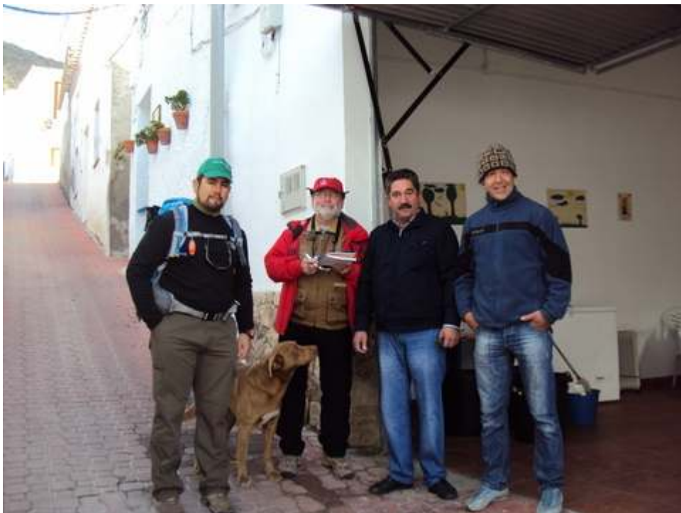
-GRUPO DE SUPERVISIÓN EN EL PUNTO DE ENCUENTRO-