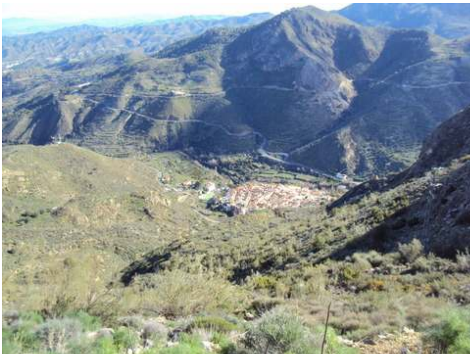
-VISTAS PANORAMICAS DEL MUNICIPIO DE COBDAR-