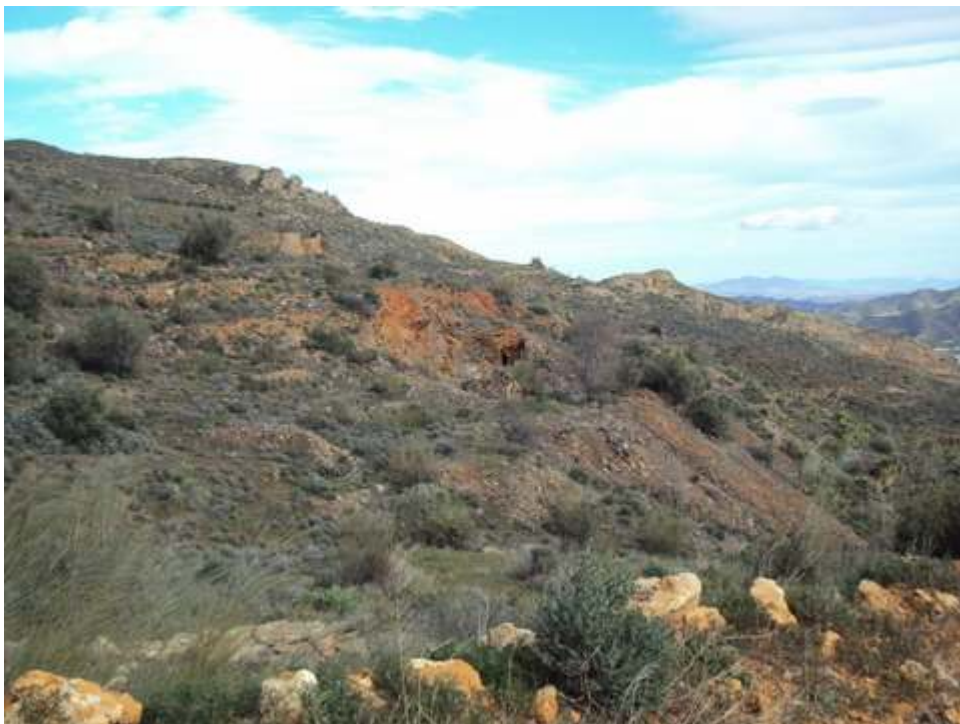
-MINAS DE HIERRO-