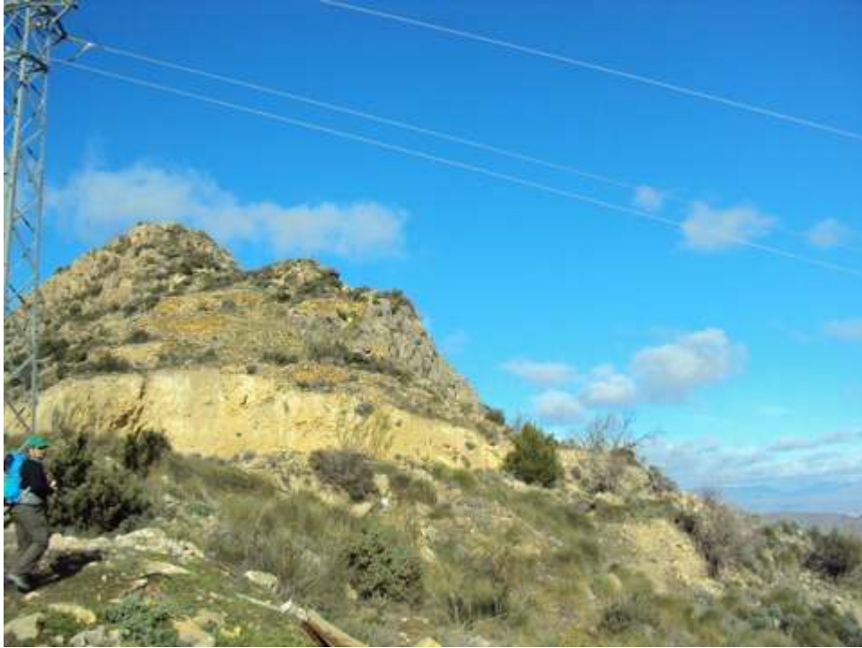
-RESTOS DE ALCAZABA-