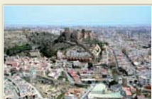
► La ciudad actual desde poniente, antiguo barrio de al-Haud, hoy La Chanca

Sin embargo, la arabización de costumbres, idioma y cultura, junto a la normalización religiosa, supuso una fuerte integración social.