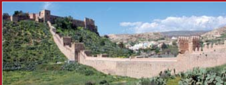
► La muralla de Jayrán, La Hoya y la Alcazaba.

Su verdadero fundador fue Jayrán, uno de los caudillos militares esclavos (esclavos, después libertos y con frecuencia eunucos) que se hicieron fuertes en el Levante peninsular.