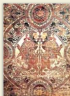
► Tejido árabe procedente de Almería.