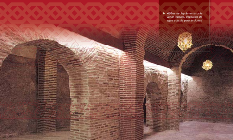
► Aljibes de Jayrán en la calle Tenor Iribarne, depósitos de agua potable para la ciudad