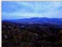
Mirador natural. Panorámica del valle del Almaraz