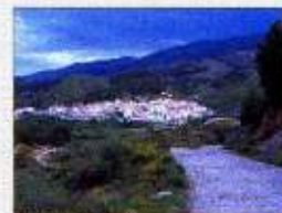
Panorámica de Sufli

Los habitantes musulmanes de Sufli se autodenominaban "los de abajo" que es la traducción del nombre del pueblo (Sfay, Sofli, Sufli)