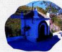
Ermite de la Cruz de Sufli

Se parte de la Fuente del Pueblo junto al cauce del Río Sierra. Salimos al pueblo por la carretera que lo bordea en dirección hacia el Municipio vecino de Sierra. Al llegar al puente atravesaremos la carretera para tomar el llamado Camino Almería. Se pasa el Cementerio teniendo aquí la llamada Rambla del Sol que nos ofrece las dos alternativas del sendero (Variante larga y la variante corta). La corta es bajar por la Rambla del Sol hasta salir a la Rambla de Purchena en la que volvemos a coincidir con la variante larga. La larga continuaría por la derecha hacia los antiguos Hornos de yeso junto a unas antiguas canteras. Continuaremos por el carril que hay por encima de ellos ascendiendo hasta la cota máxima (819 m.) para desviarnos por un carril descendente a la izquierda bajando por unos olivos hasta bajar al Barranco de la Higuera y salir a la Rambla de Purchena que nos lleva hasta el Río de Sierra. Lo cruzamos y realizamos el ascenso a la Loma de Arnuña para bajar luego por pista asfaltada de nuevo al Río de Sierra y a la Fuente del pueblo de la que partimos en inicio.