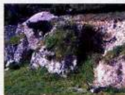
Restos de antiguos hornos yeseros