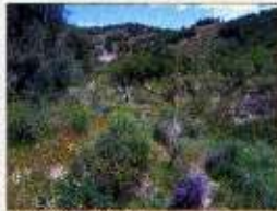
Barranco de la Higuera

OBSERVACIONES: Conviene llevar un calzado adecuado, agua y comida, así como bloc de notas, cámara fotográfica, etc.