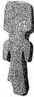
Nº 1- Villarosa y Rada