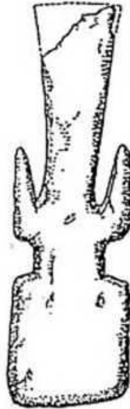
Nº 4- Leisner