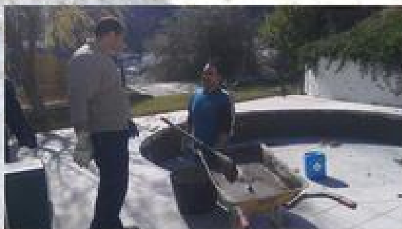
MEJORAS EN LA PISCINA