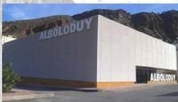
FINALIZACIÓN SALÓN SOCIAL