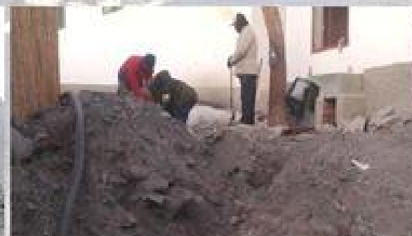
C/ ACCESO A LA PISCINA INVERSIONES DE DIPUTACION Y EMPLEO 30 +