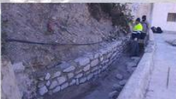
PEDRIZAS, PFEA. APOYO A LA CONTRATACION