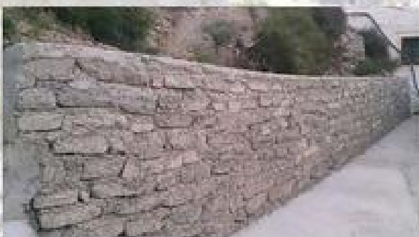
PEDRIZAS, PFEA. APOYO A LA CONTRATACION (RAMBLA)