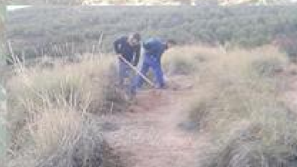
MANTENIMIENTO DE SENDEROS