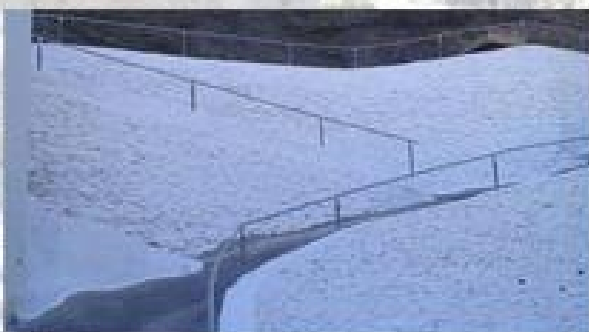
ALUMBRADO AREA DEPORTIVA/INSTALACIÓN BARANDA MURALLA