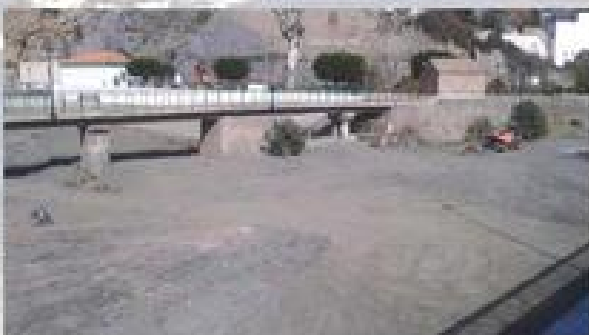
LIMPIEZA PLAZA VIEJA Y LIMPIEZA DEL RIO