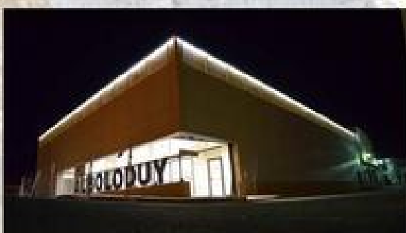
FINALIZACIÓN SALÓN SOCIAL