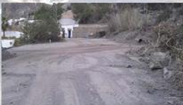
ESPACIO MULTIAVENTURA 15%