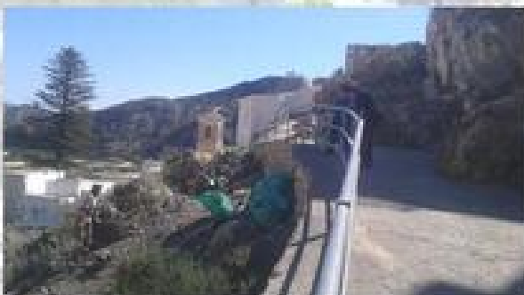
MURALLA DEL PEÑON DEL MORO