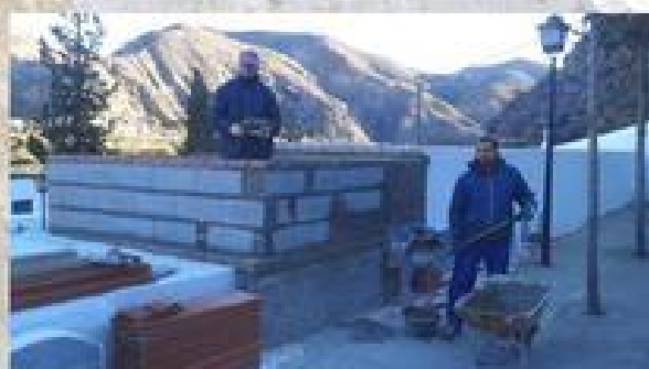
PARQUE INFANTIL LAS ALCUBILLAS