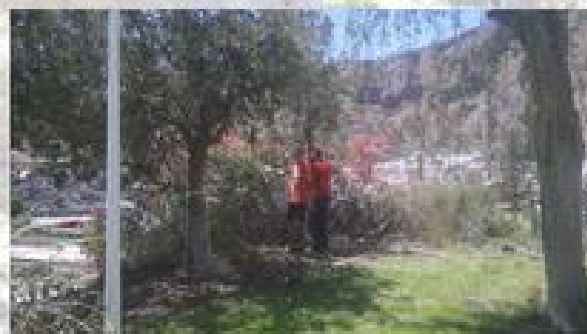
MEJORAS EN LA PISCINA