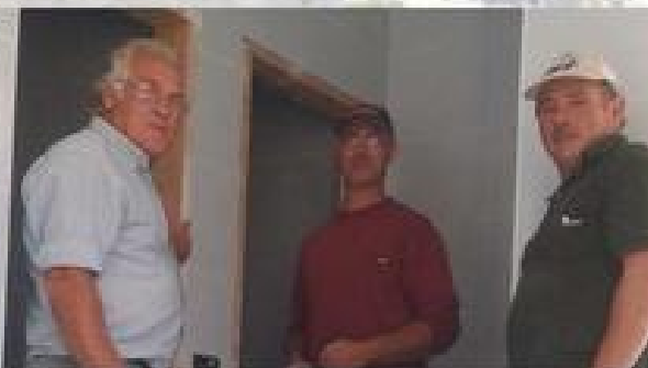
ESPACIO MULTIAVENTURA 15%