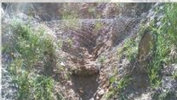
VALLADO Y RECONSTRUCCION DE PEDRIZAS DEL GAMONAL