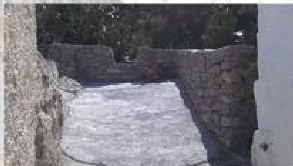
PEDRIZAS, PFEA. APOYO A LA CONTRATACION (RAMBLA)