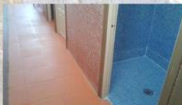
MEJORAS EN LA PISCINA