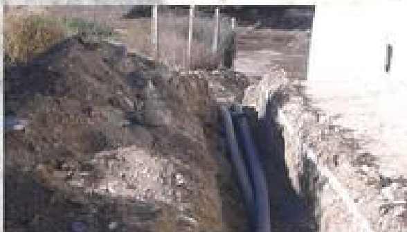
MURO Y OBRAS DE ABASTECIMIENTO Y SANEAMIENTO LAS ALCUBILLAS