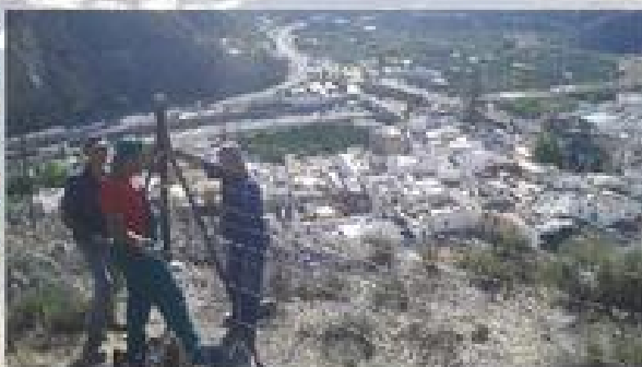
VALLADO Y RECONSTRUCCION DE PEDRIZAS DEL GAMONAL