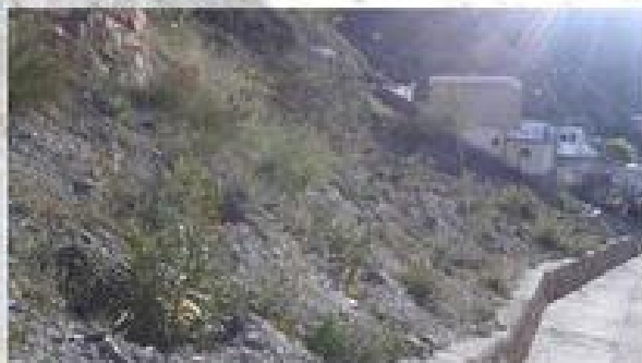
LIMPIEZA Y EMBELLECIMIENTO PUBLICO