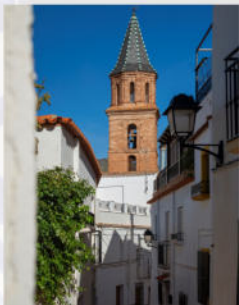
▲ Calle de Fondón e iglesia

La Casa Palacio de las Godoyas es un centro de interpretación dentro de un emblemático edificio del siglo XVIII que pone en valor el legado histórico y cultural del municipio. A través de sus exposiciones, sabrás más sobre la importancia de la minería del plomo en la región, el uso del agua, las costumbres de la hidalguía rural y el papel de la casa palaciega como centro social y económico de su tiempo. Además, conocerás la historia rural desde un punto de vista de género, que hicieron de este lugar un símbolo de prosperidad, lucha y resistencia de las mujeres rurales.