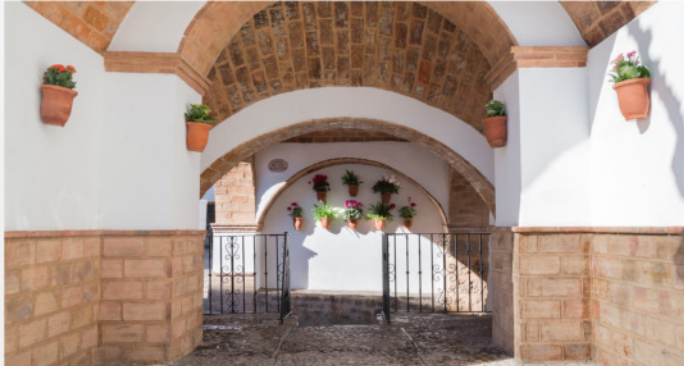
Arco de la lonja ▲