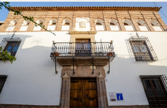
Fachada de la Casa Palacio ▼