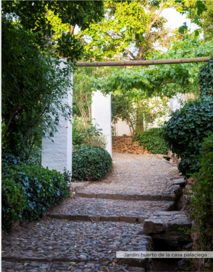
Jardín-huerto de la casa palaciega