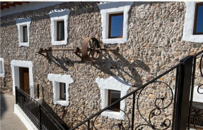
"Molino del Lugar" ▼▶