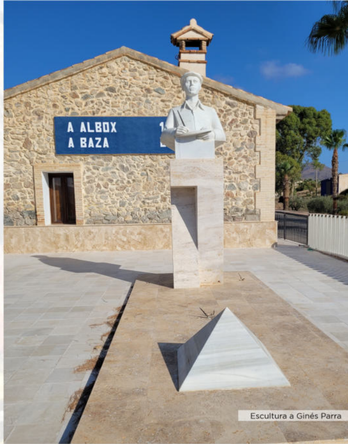
Escultura a Ginés Parra