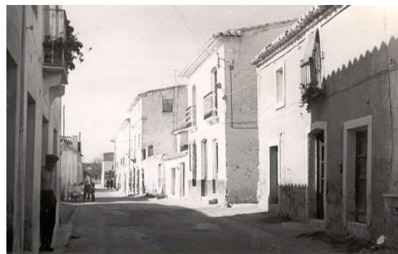
Antigua Carretera A-334 Año 1966. Actual Avda. Rey Juan Carlos I