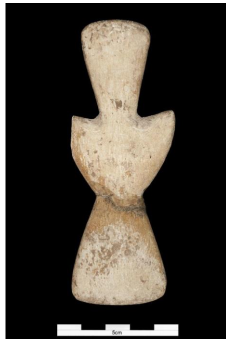
Ídolos de la sepultura del Llano de la Media Legua. Según el Museo Arqueológico Nacional, son ídolos de tipo cruciforme con brazos desplegados a manera de ala.

La información más antigua que se conoce referente a Fines es un cartulario conservado en la Catedral de Toledo fechado en 1242 en la que bajo el reinado de Fernando III de Castilla se produce la toma puntal de su fortaleza por el adelantado de Murcia Diego Sánchez: