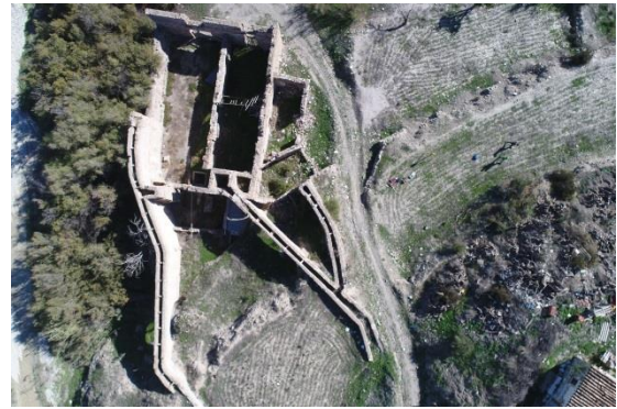
Fábrica de Los Catalanes. Vista aérea actual

La transformación económica comenzará durante el siglo XIX con la instalación de la primera fábrica de aserrado de mármol (fábrica de Los catalanes ) de la comarca en la orilla del río Almanzora en 1837. A partir de este momento surgirán pequeños talleres familiares dedicados al trabajo del mármol que provocarán un aumento de este sector hasta que a mediados de la década de los 80 del siglo XX, se produzca el traspaso definitivo de la agricultura a la industria del mármol y sus derivados.