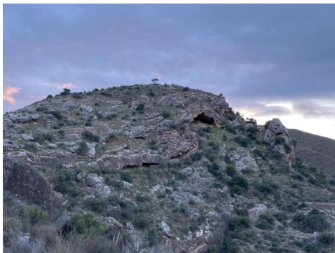
Cerro del Castillo

La información más antigua que se conoce referente a Fines es un cartulario conservado en la Catedral de Toledo fechado en 1242 en la que bajo el reinado de Fernando III de Castilla se produce la toma puntal de su fortaleza por el adelantado de Murcia Diego Sánchez: