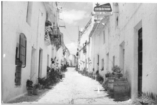
Vista Calle Lázaro Año 1966. Actual C/ Alejandro Estrada

En cuanto al urbanismo de la población, vemos como todo su casco histórico se articula a partir del camino real que atravesaba la población, la actual Calle Real, que constituía la principal arteria del valle del Almanzora. A esta vía confluyen las principales calles con un trazado regular que indican un gran orden de planificación. La configuración del municipio, por tanto, dicta mucho del de otras poblaciones en las que las calles siguen un trazado sinuoso, herederas de las antiguas calles medievales de tradición musulmana.