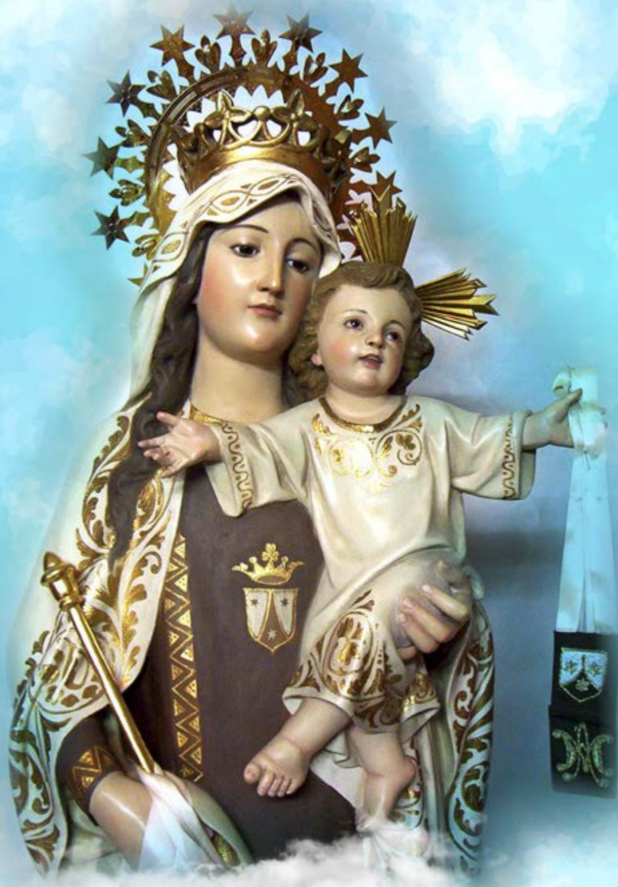
Nuestra Señora la virgen del Carmen PATRONA DE LA ALFOQUIA (ZURGENA)